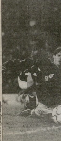
ტოტენჰემი - ლივერპოლი. აქ უკვე ბლიტინგერლი წინა კოლეგიალური მფობრის ტელი შერინგის გუნდის ყოფნის ცეცა

10 ლორესი (62), 11 მარტი (66) 11 მარტი 2002 წელს, ფორსი 21 მარტისათვის 01 ფორსი 21 მარტისათვის, ფორსი 21 მარტისათვის