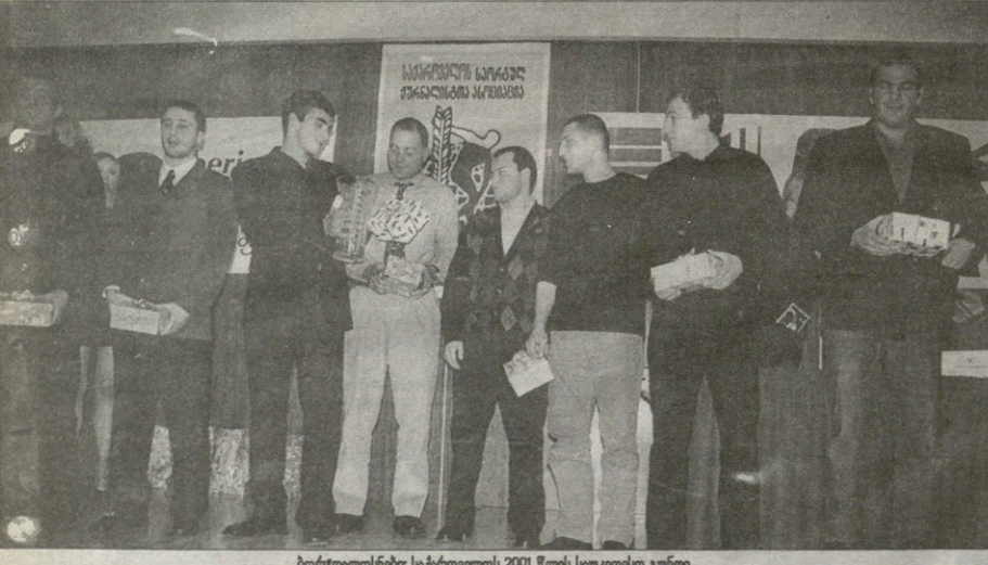
ბორბდობნებე საქართველოს 2001 წლის საუკეთესო გუნდი