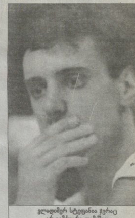
ვლადიმერ სტეფანიას ქვარა...