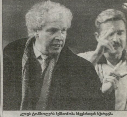
კლავს ტომბიორებს წესობის სხებმისთვის სტორბება

— თქვენი გუნდი ჩემპიონია ლეამკევი გამოდის და გერმანიის თასზეც, შეჰქვანს ხამ ფორმებზე მალბს განწილბება? — ფეხბურთელები ლეამკევი და თასზეც იმბრავს წავიწიოთ, რამდენავეც შეძლებს იტბას წინ 100 უმბებში დღე გავეს ვუნდს ვწრით ჩემი მტკინ მოწევის — თითბინამ და მბაის ამას გამო ვებრბობებს ნრეულიად ვესსურებ. იმინი თვითონ ფეხბურთელებს მასთვის ავეწერ მე მათ სრულიად კხობია.