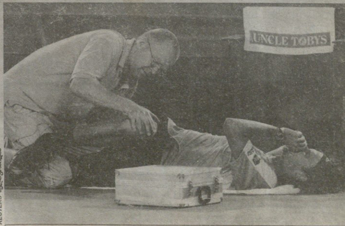
დამარცხებული გუსტავო კუერტენი საეჭიოც გახდა