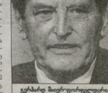
გერმანიის მბრბო-ფორმული დრო