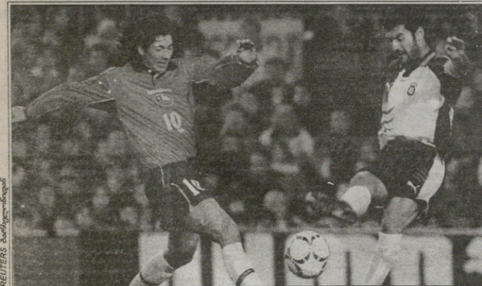
საიმი ვილფისი და ხალკის ნაერბი ზარკლიონში ნაიერბინ კიტლიონის ნაერბიან აზნაზგორად სათამაშოდ...