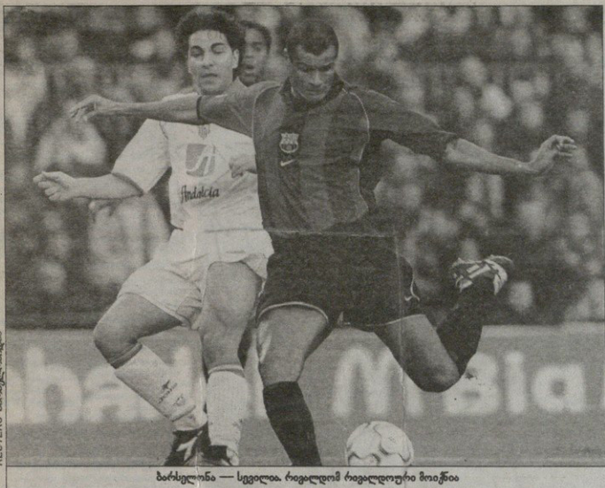
მარსელონა — სვედია. რეგულარული რეგულაციები მოიწვია