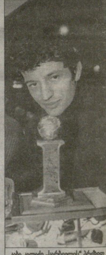
კბბ კბლბე "სარბიელის" პრბიბი