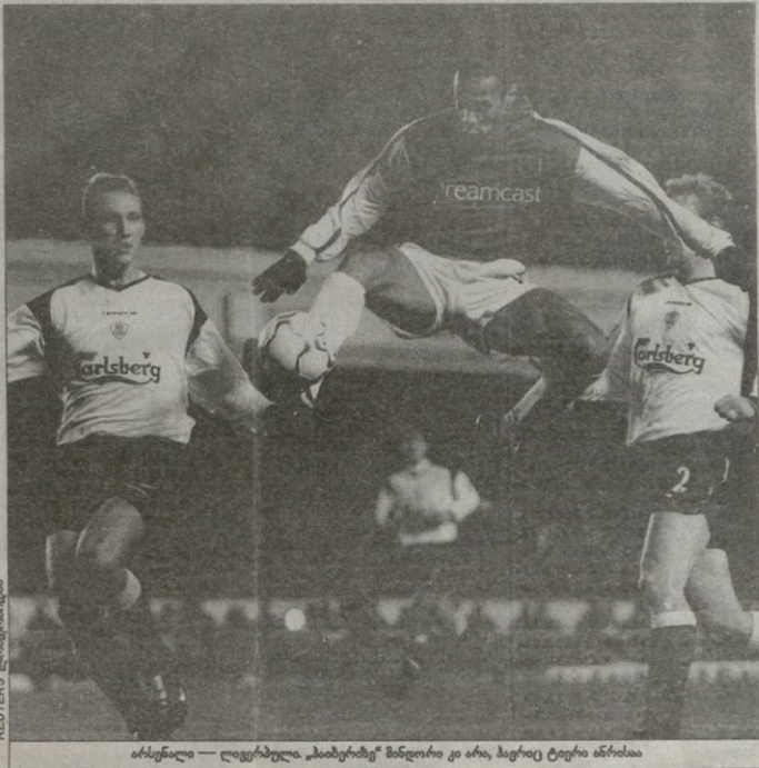
ასისტენტი - ლივერპოლი „მარტისათვის“ მარტისათვის ანა, მარტისათვის ანა

საქართველოში 13 მარტისათვის 10 მარტი (3), 11 მარტი (40), 21 მარტი (46) საქართველოში 13 მარტისათვის საქართველოში 13 მარტისათვის