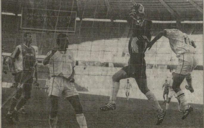
„დინამო“ — „ტრაპელს“ დავამა აწი უცხოელებიე ჩაეხევაან