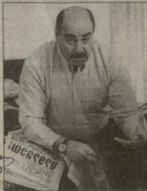
რუსეთის ნაკრების ქართველი უფროსი დღგბს კავთელმწვილი

65 ქორნილის თაგალით, უხროგი ტანკით და, რა თქმა უნდა, ბრალდებით ქართველები რუსებს ჩაბრაჰენ