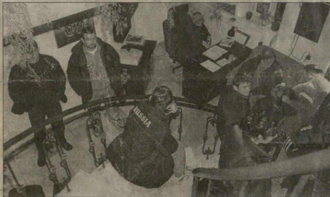
ღოფები „ციცინათელს“ შეესივნენ