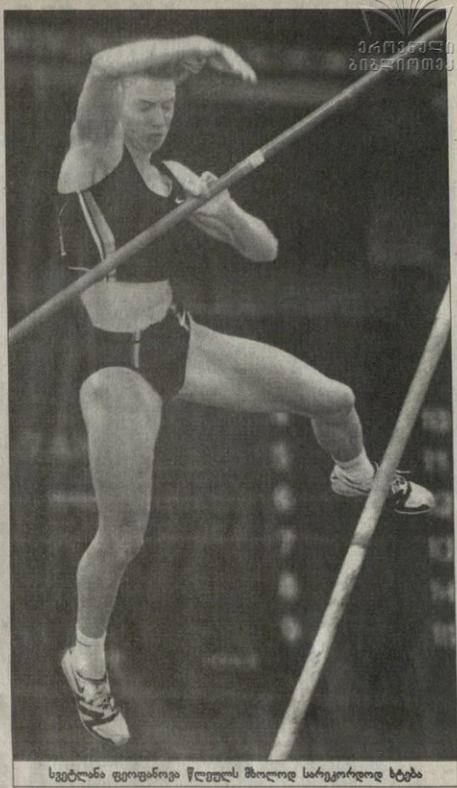
სეკლავი ფეოდალიზმი წლებს მსოფლიო სარეკორდოლ სეკლავი