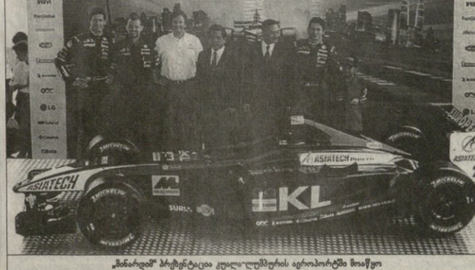
„მინარდი“ პრეტენციული კუალა-ლუმპურის ავროპატრის მონაწილე