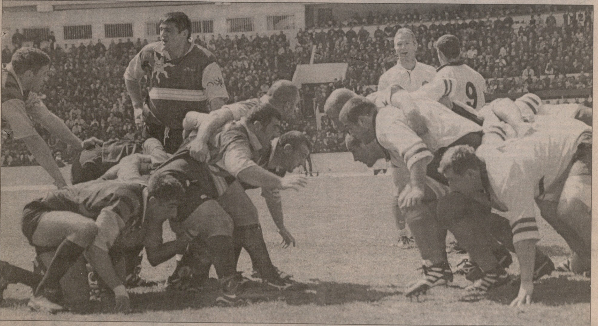
2000 წლის 2 აპრილი. საქართველო — რუმინეთი 2:23. აბა, ბუქარესტში იქნება ჯახი!

ევროპის ერთა თასი. მხნეთა ჯგუფი. 7 აპრილი