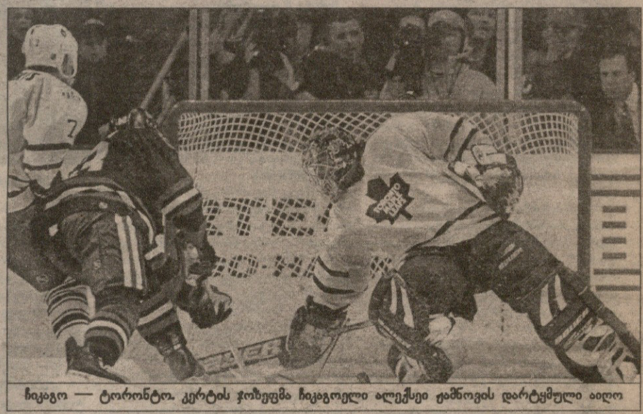
ჩიკაგო — ტორონტო. კერტის ჟონგუმა ჩიკაგოელი ილექსიე ქაშოვის დარტყმული იალო