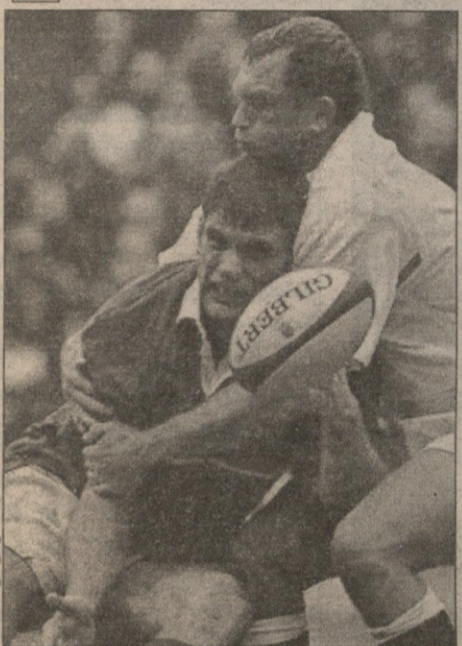
ინგლისი — საფრანგეთი. რიჩარდ პილმა ფრანგთა კაპიტანი ფაბიენ პელუ შებოჭა