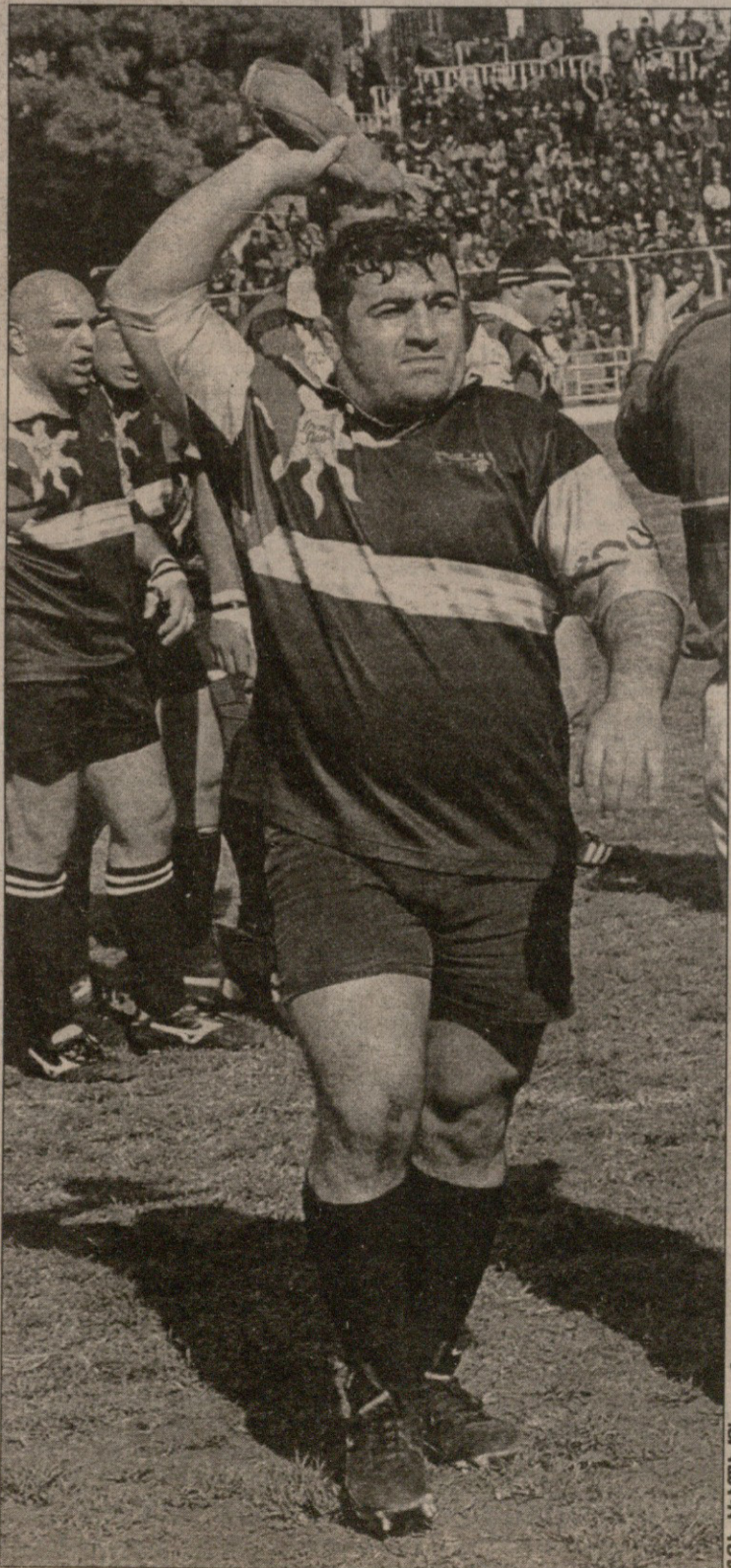
მის ახალბაშის ფოტო