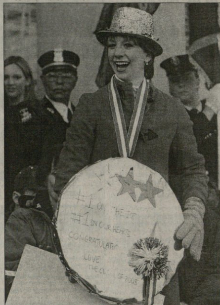
REUTERS ბრუნი ნეშოვიჩი

სარა მარია ბერეისი ახალი ვინაია. ფიგურულ წყნარებაში აღიზნო ჩემპიონის ქალაქ-ქალაქ დაატარებენ და პატივს მიაგებენ ახლი სარას მშობლიურ ქალაქ გრეით ნეშოვიჩი და იქ მშობლებს უსწრებით უპირადი, მაგრამ გულიანი ნაყვით შევლია.