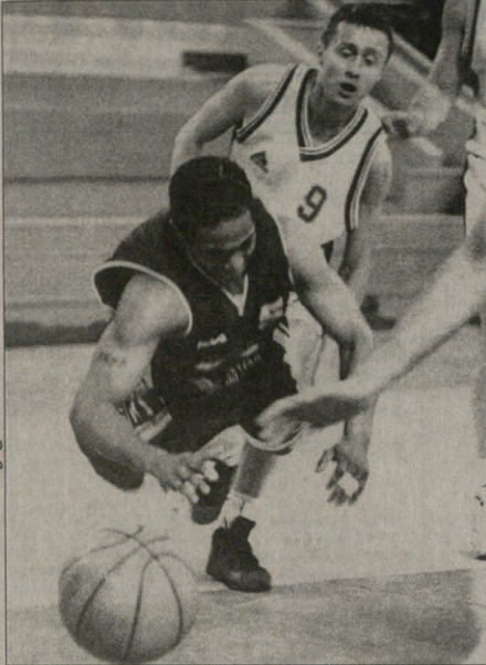
დინამო — ბასკო ბათუმელებს წაგებდა, როგორც ყოველთვის, თვე არ დაუხრებია