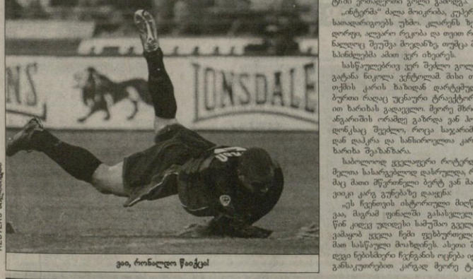
ვაი, რომელი წაიქცა