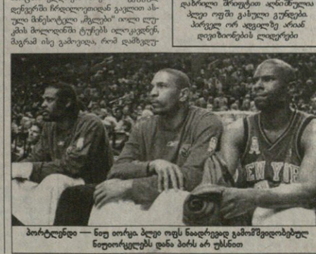
პორტლენდი — ნიუ იორკი ბუილ რუს ნაიდგედავ გამორევილითუბელ ნიუიორკელებს დინამო ბასკ არ უტნობი