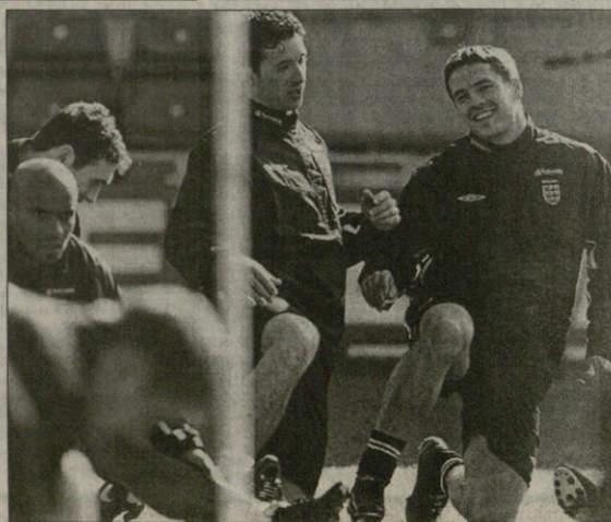
უბეკემო ინგლისის მიკლო ოუენი (მარჯვნივ) უკაინტენს