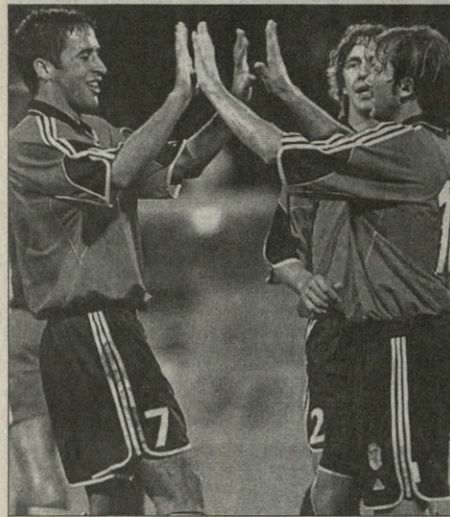
რაულმა (N27) და მენდიეტებ ხელი ხელს დაქვს