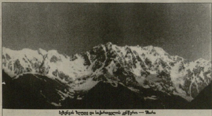
ბეტნენის ზღუდე და საქართველოს კერწარი — შარი