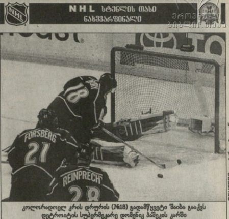
კოლხალიდოე კრის ღარჩის (N18) გადაწვევით შაბაბი გაიქს დეტროიტის სუპერმეგარე ლინეჩე პაუესის კარში