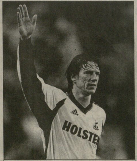
ტრანსფერულ კრისტან ცივის ჭეული დავა აღარ იფარდეს

ცივის ხაზარო ფისი მშინ 7,5 მილიონი გირანქადი იყო. სხვათა შორის, ამგნს ვეკავამბობდენ „ბლუზერ რინდერსი“ და „ჩელსი“. ანელკას „ლივერპულს“ ორგნა. ამას ისიც დავამტრტა, რომ ჩვენს მიმინებულ მწვერვალში ბრძანა რომისნი გუნდის თამაშს ცივიზე აგებდა, გერმანელის წასვლამ კი ვველოვრო თავდადრდა დაავნა და „მალბორი“ მის სეზონში მეთითმბეტე ახლავს დავაკა — გასაცხადა ფილისის.