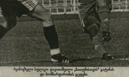
ჩემპიონული სეზონი დიციუსი „პოლიციის“ ვეგეტარია და მათთვის ვეგეტარია