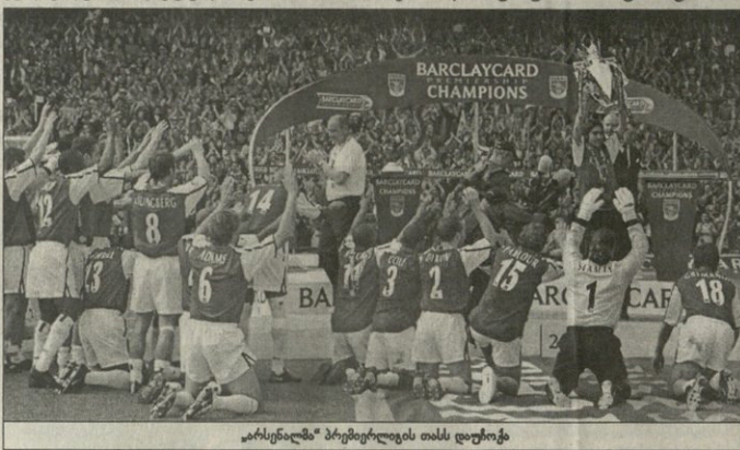
„არსენალი“ პრემიერლიგის თასს დაუბრუნა

საინტერესოა, როგორ გამოჩნდება პრემიერლიგის განვლილი სეზონი, გუნდების ბედი რომ თითო პატარა ბარათზე დავტივით. კარგა ხანია, ინგლისში არ ყოფილა ისეთი სეზონი, ჩემპიონობისთვის ბრძოლა რომ ამგვარად განსივლიყო და ბოლო კვირებამდე ჩემპიონის ვინაობა გარუკვეცივლი ყოფილიყო. გამარჯვებული კი „არსენალი“ შეიქნა, რომელიც სამწლიანი შესვენების შემდეგ კვლავ დუბლს დაუფლა, ჩემპიონობასთან ერთად ასოციაციის თასიც მოიგო.