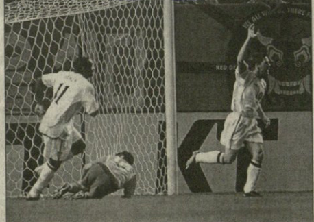
მაიკლ ოუენმა გოლი „შპიტისის ფესტბი“ აღწინა

და ანგარიში გახსნა. ამრიგად ოუენმა 34-ე სანაკრები შეხვედრამში მეთორმეტე გოლი მიითვალა. მერე ტრავმი ვითარება რომ შეიცვალა, თუმცა მოგახსენებო, კორეულია მიმტეტების აღწერით კი თავს არ შეგანწინებ, მხოლოდ გოლებზე ვეკრება — მასამბლემამ კეთსური ჩაასოლეს, საჯარიმში კი ინგლისელებს პარტი უბეჯაუეროდე შეჯავდა დატრავებული და მანაც გაითარინა.