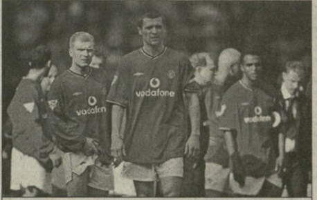
რონი ჯინის ნაყბატარია მანჩესტერ იფინტილი“ სეზონისათვის დობა