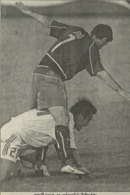
ლუმი ფრანც იმ ფონტანეს შემოსატი