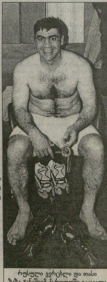
ჩუხული ვერცელი და თასი ზამა ჩანამამე ქართულში გაყვალა