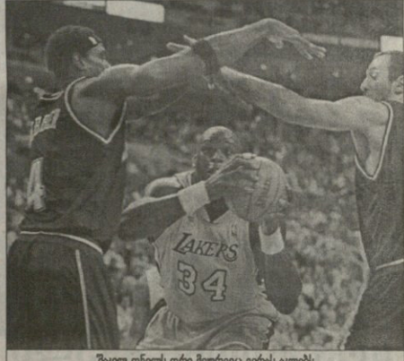
შეაილი ოლი ორი მუხვებზე ვერსი ადგეს

26 მათი ლიუს ანგულის... 2003/04: ფოკსი (9), ბრინტონი (25), ფოკსი (4), პირსი (18) ქულა, 14 მიწინა, ოლი (27) ქულა, 18 მიწინა; შოუ (9), მანკოტი (5), უოლინი (3), შოუ (19) ქულა, 12 მიწინა; ფოკსი (20), დედა (23), პირსი (7), პირსი (8), ფოკსი (9).