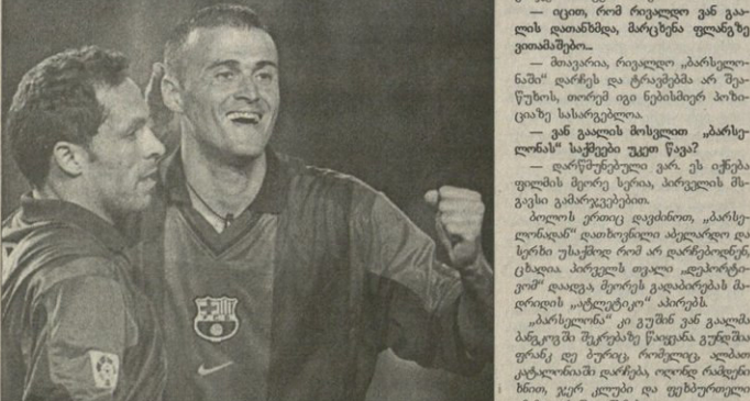
სერხის თუ ვაიმეტანდენ, ლუის ერრეკის არ ეცნა