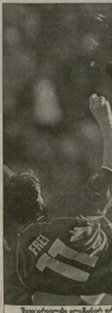
შვეიცარიული ბელგისანტი ფრისი (N11) თავგანთავად ვერ იხსნა

ბაღი პოსიანი გამომდინარე და სკანდინავიის ატარა იტალია კოჩინის ვალით დაასაძრა. საქართველო 20 გოლიანი 10 მანკე (82), 20 სორინი (70)