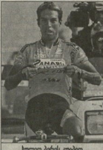
სული პირის უკრაინა