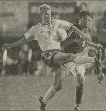
შვიდი ნიკოლას ალტანდერსონი (N17) და გაბაიონელტული ბაბილილილი ალტანდერსონი საწერში

პორტუგალია 02 პრეტენსია 01 პორტუგალია (81) 02 პორტუგალია (62) 03 პორტუგალია (81) 02 პორტუგალია (62)