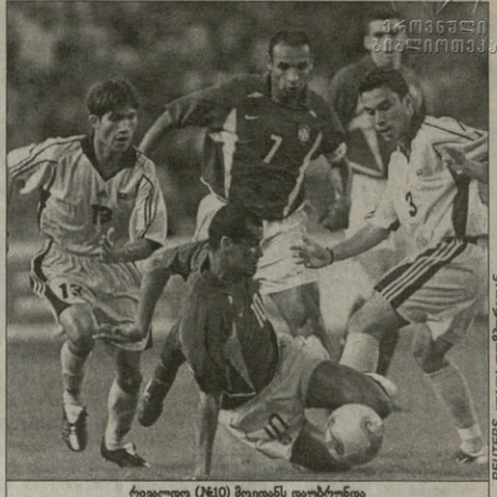
რიაელი (N10) მოედნის დატყეობა და მეურვეობა, ცხელი, არ მოკლები