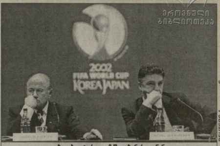
იხვევ ბლატერი და მიმელ ზენ რუფინი დღეს საღამომდე ერთმანეთს აუჯს არ იტყვიან