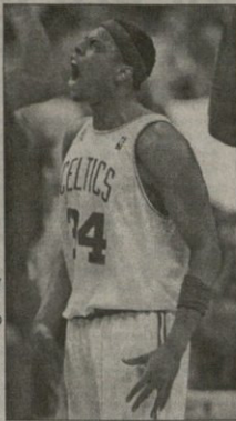
პოსტინმა შეუღებულ შვილს

25 მათი ბოსტონი... 9490 ნიუ ჯერსი... 2003/04: ანდერსონი (16), ე. უოლინი (6), პირსი (28), ფოკსი (22) ქულა, 12 მიწინა, ბაიტი (5) რაუნდში (10) დედა (7), მანკოტი