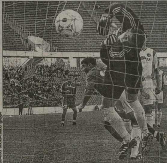
ზამა მამამი სიტყვა მესამლა, „ლოკომოტივის“ მორე გოლი მისი იყო