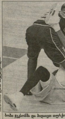
ბობი ექსონმა და პილითი თურქულულ კობი ბრაიანი ბეჭებზე გაყვარეს

შარშინ იყო, როცა ფინალში „ფლადელიქსის“ პირსი თამაში დროის მატჩში ანგულისათვის ის მატჩი ერთადერთი იყო შარშინდელ ლევი ოუბს ახლა კი „ლიუისის“ ხელზე შოუზე წაიყო „საქარაგებოსთან“.