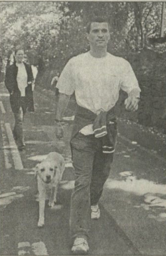
როი კინმა ტუნია იმაველ ვაიარა