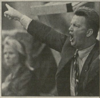
ბელაროს ლუის ვან გაალმა გარისკენ მიუთითა

ან ჰარნი კი ვან გაალმა თვალის ძირველ კატალიზებს აღვივალა და სერხის დადგა აქვე ვიქნათ, რომ გუნდიდან ხოცვ ვეკარაილას წასვლის შემდეგ „ბარსას“ კაცინტიანა ერთბაშის სწორედ ზემოთხსენებული ფეხბურთელები ითავსებდნენ. პოდა, ადგა ვან გაალი და „ბარსელონაში“ უკამპეტივობებს გარისკენ მიუთითა.