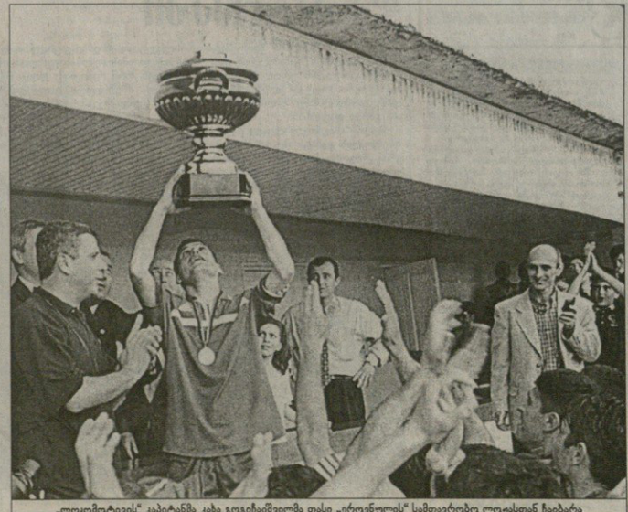
„ლოკომობიტეის“ კამბიტანმა ესა გვიგინამეფულმა თასი „გორკონელის“ სამთავრობო ლეგისთან ჩაბარა

34-ე წუთზე ზეიად სტრუვად დავითი შეიქვემედილის დარტყმული მიოვიგრა, ბურთი სულყო დავითაშვილს მიოვი-და და ჩემპიონატის მთავარმედილემ უოტად დარტყა — 1:0. შედეგებამდე „ლოკომობიტეის“ ვიფეე ქეივლა მანერტები, სიბინას წაქცე-ობის დანერულ სეარაშიომ კარს ასევეა სულ ბილი, კი მუკარას ბაქნში მუიე ვანამაის ბურთი ფეხზე მოხვდა. მსო-ფლად მოხვდა და ტაიფი დასწრება შეიქცნება ხალხისანი გამძლევა — ვაიოქმულამა მუიერეცე ვოიფინი მასარ-მეც, თავითი კინეფლის სისწრაფის ჩემბ რეგორდი, ზეო წუთში 700 აცენწვლა უნდა ვაეკურფიფიფიფი, შეპარულა, 804-ჯერ აცენწვლა და ბილის თავეც ბურთი მუიერეცელებმა დავითეცეც დაეკრა.