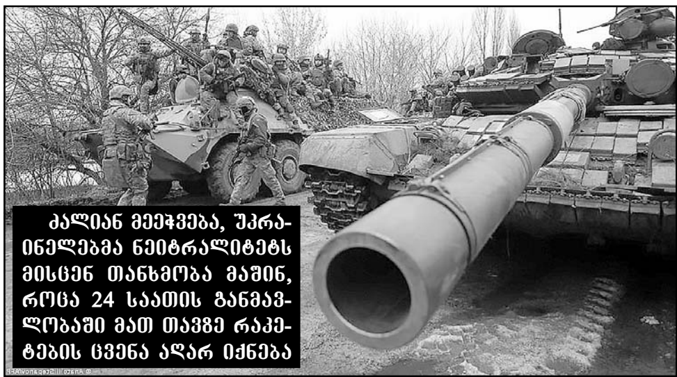
აალიან მიეჭება, უკრა- ინელებმა ნეიტრალიტეტს მისცენ თანხმობა მაშინ, როცა 24 საათის განმავ- ლობაში მათ თავზე რაკე- ტების ცეცნა ალარ იქნება

— ომი რომ დამთავრდება, ერთი წლის შემდეგ როგორი ვითარება იქნე- ბა, ეს სანქციებზე დამოკიდებულია. თუ სანქციები ერთ წელს იმუშავებს, რუ-