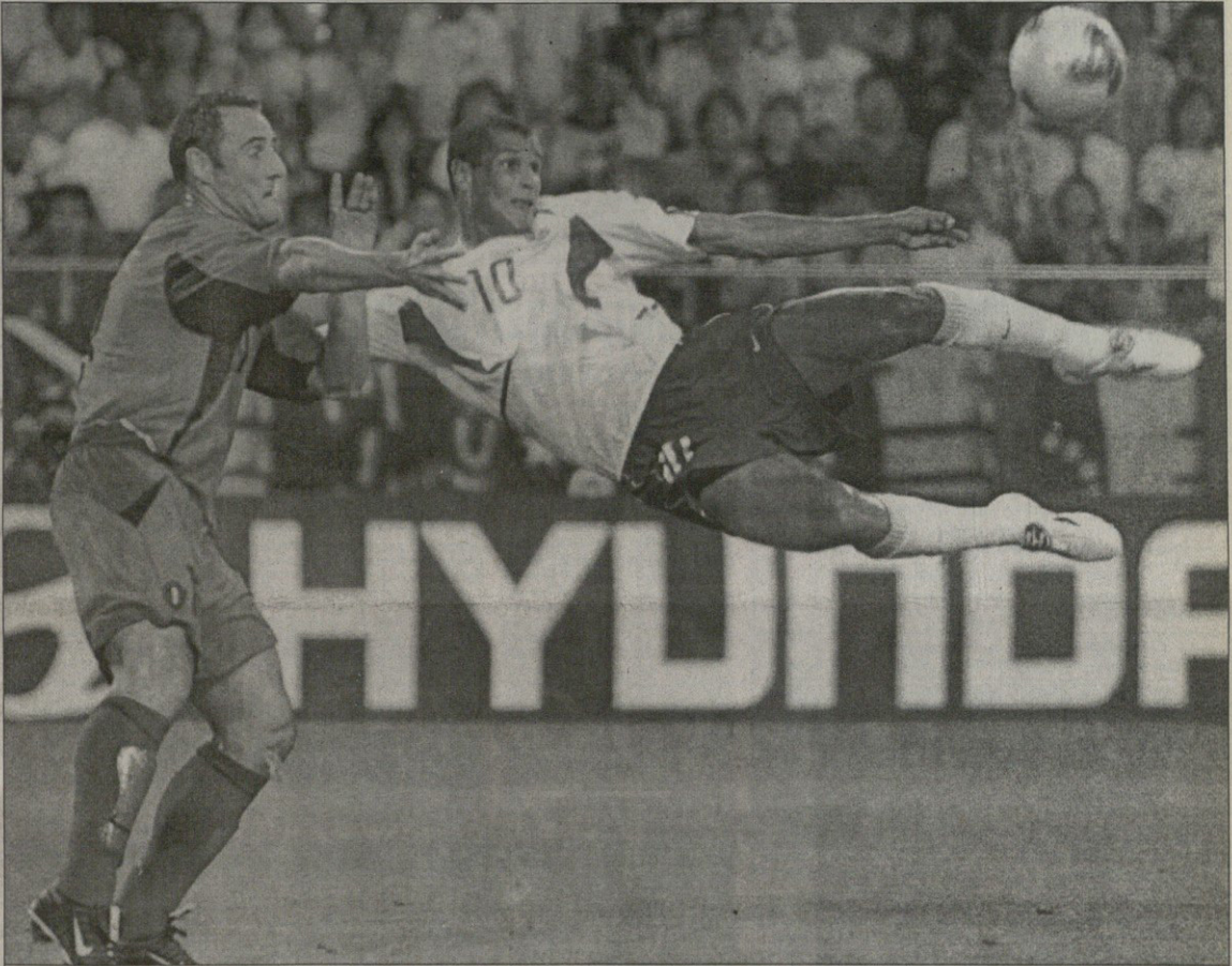
ბრაზილია — ბელგია 2:0. ეს თამაში რიველდომ მოგვიტოვო, თქვა ბელგიელთა მწვრთნელმა რობერტ ვესენმა