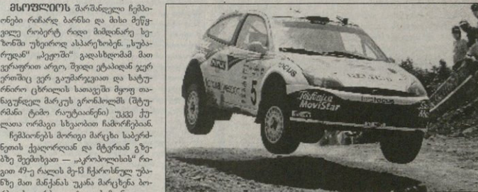
კოლენ მაკრის ავტორი საბერძნეთში ახლახან ვეფობს