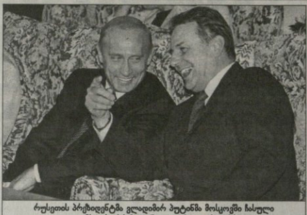
რუსეთის პრეზიდენტმა ვლადიმერ პუტინმა მოსკოვში სასულიერო მამულებს პრეზიდენტს დაუბალა