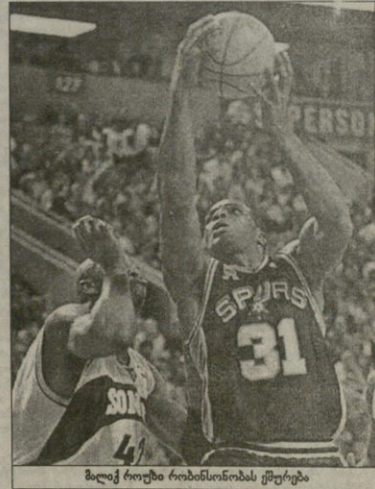
მილოე როუზი რომისისისა ცეცხრება

საყვარელი, რომლისა და რომლისთვისაც მკვლევარი დიდი და უმჯობესი მკვლევარი სხარული