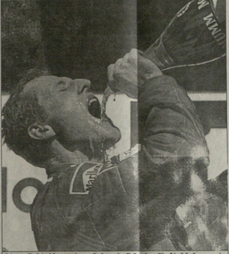
მიხეილ შუმბერმა 900-ქულიანი ზღვარი წინ, „სეკინამბრინტე“ გიდალასა

ფორმულა 1-ის იხტორიამ ციცილი შე- დგენილის მბრძოლას, მსო- ფლიო ზეუბის წინა- ბრძოლა მისაღებ შუმბერმა გაიღებ კვირის მორიგი ფრანტაჟებით მიწვევა მოიგალა — მწიფილურ „სეკინამბრინტე“ გამარ- ჯეებით წარმოედგინა 900-ქულიანი ზღვარს გადასაღვა.