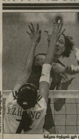
ჩინელი რუსების ვერ დღეობა

ეს დიდი წინადადებაა ნაბიჯია. ვერ ვიტყვი, რომ ამ წესის შემოღებით მსაჯულთა საქონათად გატრება ტრენინგებთან და ისინი მათი უყოჩაღესი ატრენინგების, მათმა მამამთა მოთმისა და ატრენინგების მოწყობის ფუნქციას ბერტინი თანტოლებთან დაიძღვა.