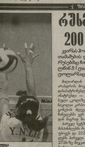
ჩინელი რუსების ვერ დღეობა