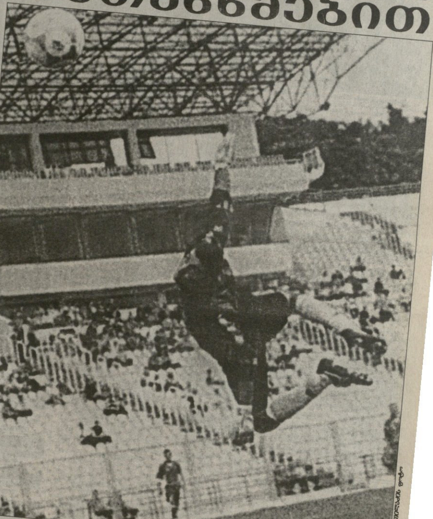
ლოკომოტივი — დღეს 30. სამი გამართული მატჩიდან ერთში, მასპინძლებმა გორაკის მეგობარ გეგარანად იმეზღეს.

„მეტალურგი“ — აღინაშნოს — მატჩის და-მამდე ხუთი წუთით ადრე შეესტაფორე-რება თანხის ნაწილი როგორც შეაკო-რის და ფედერაციაც დაიძობაზე წყვილს ამ „მეტალურგთა პრეზიდენტმა ნუგზარ ანანა უცხად განაცხადა, თამაშზე უარს აბო-ბობს იმე მთავრის სტადიონზე მისეულ სუბულ ბაღისა და ნაწილი მატჩზე და არ უღარავს, სამსაგი კომიტეტის აღმადგენს, მატჩზე დღეგრძელად მე-დიანობითი მომსწრის გადასახადე-ბისა და შიშვანის, საბრძოლველად მე-დი დავებრება.