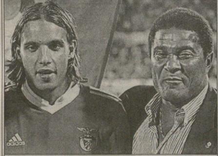
ნენე გომეში ლასბინილს ფუსკითმ წარდგინა

მისამართი: ქ. თბილისი, ჰაბა-ფაშაძეს 41, სართული 5. ტელ: (99532) 394003, ტელ/ფაქსი: (99532) 225186