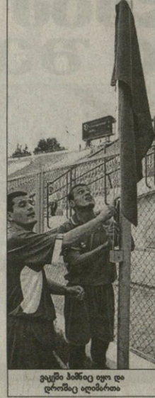
გატანი მწველიანი გუნდის მიერ

ნი ვერ გაისწორა და ბოლოს ცარიელი კარიბე მანვე მოახერხა გატანა. აღნიშნული შემთხვევის შემდეგ, რომ სხვადასხვა მარცხენა ფეხით დაიწყო, მწველიანი გუნდის ბრძოლაში დაიწყო.