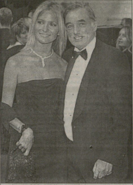
ჩორა და ილიტა ბესტბი ნარჩევ სპოვილოების კლავიეო წარდგებიან