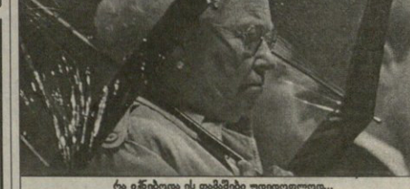
რა იტეხიდა ეს თამაშები უღდიფოლოდ...

ამაი წლის წინ ვერხილდა, რომ ამ თამაშებს დიდი ხნის სიყვარულად არ უწერია, ახლა კი რაღაცაღერად განსხვავებულ აზრზე ვეკლავთ მანქანტერულ თამაშებს სულ ორივე დავიკა ხოლმეწინა ადვილი დიდ სპორტული ღირსებების ბაზარზე და ამ გეგმურად სპონსორთა მიხედვით, მანქანტერულად დიდი ხნით განაბრება ამ თამაშების წარმატებულად. — თქვა ბრიტანეთის დახურვის შემდეგ საერთაშორისო ოლიმპიური კომიტეტის ერთ-ერთმა ლიდერმა.