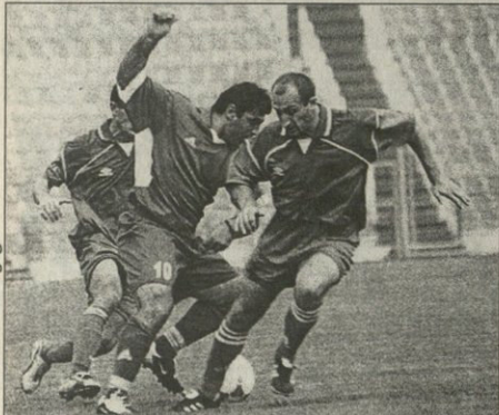
წინადაცემულმა ზამა ქანანამ გორულეც გვიანდელ აქციაში

გორული 3:0 დილა დღის შედეგი: 19 საათი 19:00-19:30 (ტელევიზია 25:00)