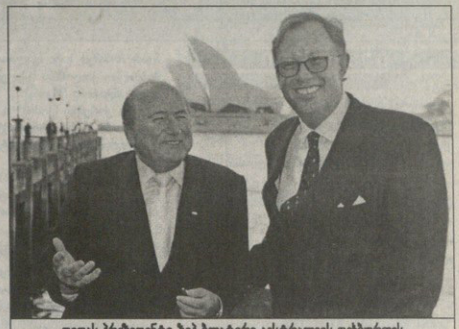
ფიფას პრეზიდენტი ზეპ ბლატარი იესტარაიის ფეხბურთის ფედერაციის პრეზიდენტი ან ნოას 2014 წლის მუნდიალზე დაბარაჯა

ღაბსინათ 2005 წლის გათამაშება ვერამინამი იმეტიმ ვახლოვი დანიშნულა, რომ 2006-ში ამ ქვეყანაში მსოფლიოს ჩემპიონატი ტრავლა და ეს ერთადერთი რეპრეზენტაცია იქნება და ეს ერთადერთი კონფედერაციაა თასის 2001 წლის გათამაშება, მსოფლიოს 2002 წლის ჩემპიონატის მასამინდელი ქვეყნებში, კორეას და იაპონიაში გაითარა ღაბსინათი, რომ ფიფას 2005 წლამდე კონფედერაცია თასის 2003 წლის გათამაშება აქვს დასაბამებულა, მეგრამ ამას არ დადობს, პირიქით, მასამინა მოსულა და კავლე ერთი მძივნივლი შეჯახებინებს, კლუბი მსოფლიო თასის ადგენების აბრებს.