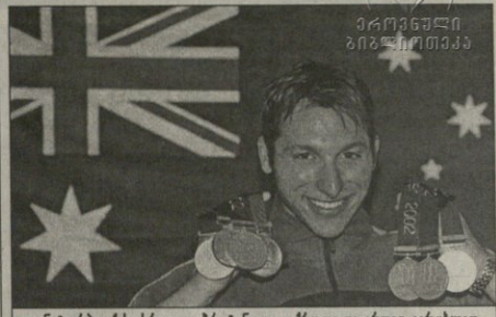
ან ტორბა ექვსი სრულადპირტანული ოქროსი და ერთი ვერცხლის

ნუს 19-ბურთიანი სხვათა გამოვიდა. მართალია, რუსებიც და უნგრელებიც მსოფლიო წყალბურთის ლიდრთაგანნი არიან, ამ შეჯიბრების ფაიერტებდაც თითქმის და წვენი გუნდის წევრები, სამის გარდა, მეტოქეებზე უმცროსები იყვნენ, ვინამ როცა 0:19 და 3:23 აგებს, ეს ყოველივე დიდად საწვეგეში არ უნდა იყოს.