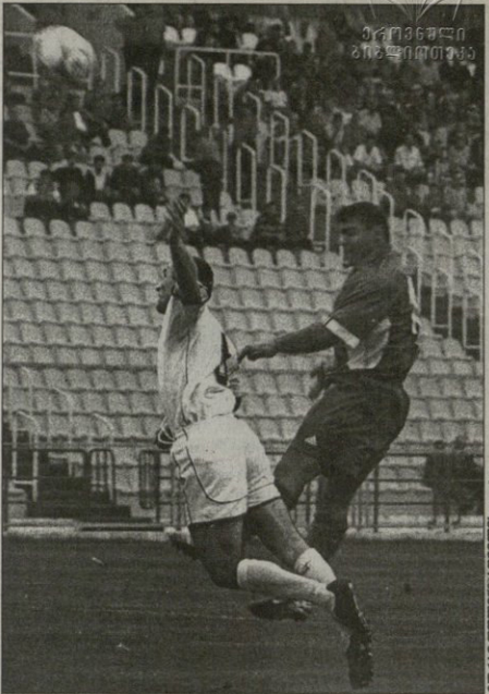
ზამა ვანია ბეგის კი ცეცია, მაგრამ სტუმრითი დაცვის გერაფერი მოუჭერას

პირველ მეტყვის სიმეფლე მარზა საზარაძე დაუერთბო. სტუმრებს სა-სკიმად მთვარე დატყობა ლომბია, თუცე რანეზი ზეღია კარის დატყობა აუღლებლად მოიგერია ბურნი კუ-ბურზე ეს 75-ე წუთზე მოხდა.