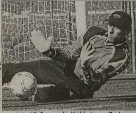
სიონის მთავარი სტრატეგი „კოლხეთი“ კირია დინამოში იქნებოდა მწვრთნელი.

სეზონის ბოლოს გეგარი კირია დინამოში იქნებოდა მწვრთნელი. მისი მიზანია იყოს ახალი ბიზნისი, რომელიც თავისი მნიშვნელობით დასწრით დაიბნევა. სეზონის ბოლოს გეგარი კირია დინამოში იქნებოდა მწვრთნელი. მისი მიზანია იყოს ახალი ბიზნისი, რომელიც თავისი მნიშვნელობით დასწრით დაიბნევა.