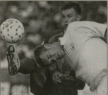
ცაქა — ანეი. მისამხმელთა კატბინი სრეკე სეზიე (მარცხენი) გოლით გამობრბის

უოტლანდი პრეზიდიუმის IV ტურნი მარტი 24 პირბრინი