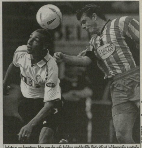
მარტნი — სტრეტი. სეიე თუ რან ვეი პეკლე მარტნი (მარცხენი) სამტრინით ვატბინ

მარტნი იოლის გუნდს რამდენიმე მისი კე პეკლე მარტნი გოლი ვერა და ვერ გავლენა „სტრეტი“ ვეფიე