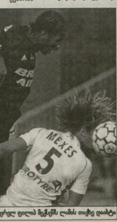
ოსტია — გენგამი ტბილი დროება ოსტიალი დიდად შეესრულა ლამის თავზე დასტოვდა