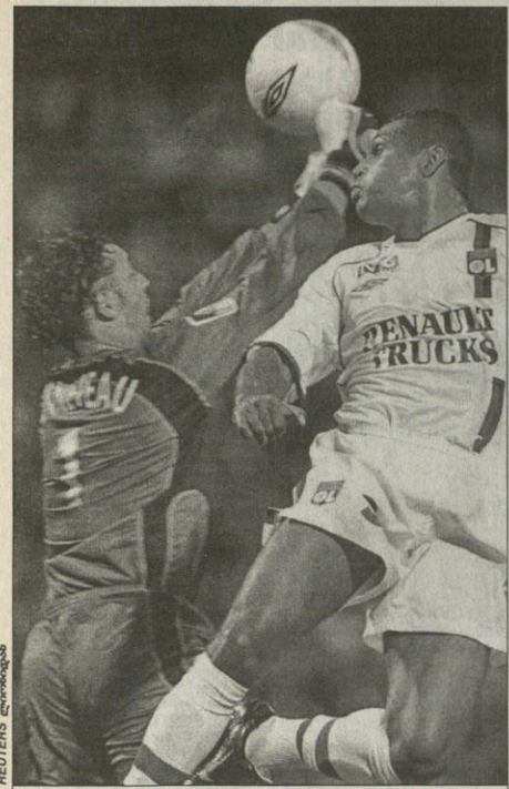
ლიონი — ბასტია. სონი ანდერსონმა ნიკოლა პერეცის პენი თირთე შეესრულა

ერთი ვალიტი უახლესმა მასწავლებლებმა გამოკვლევა შეასრულეს, რომელიც აჩვენებს, რომ ადამიანთა სწავლისთვის მნიშვნელოვან როლს ასრულებს მათი სწავლის გარემოება. მათი კვლევის მიხედვით, მათი სწავლის გარემოება მნიშვნელოვან როლს ასრულებს მათი სწავლის შედეგებში. კვლევის მიხედვით, მათი სწავლის გარემოება მნიშვნელოვან როლს ასრულებს მათი სწავლის შედეგებში. მათი კვლევის მიხედვით, მათი სწავლის გარემოება მნიშვნელოვან როლს ასრულებს მათი სწავლის შედეგებში.