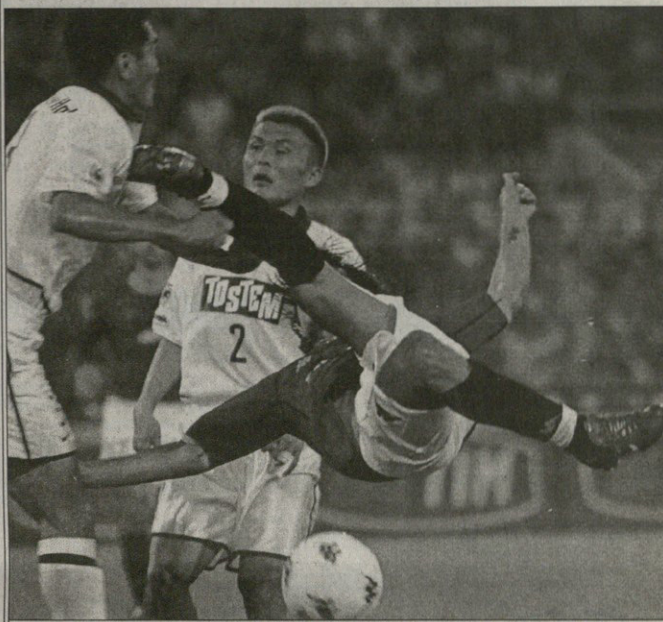
რომა — კამბი ანთოლიკა ვინდენო მონტელის მარაგებულ იმთინელები გაიყვრა

დაბადებით არის ცნობილი ისიც, რომ სანამ იმდევ-ავიები ასევე მან საქმიან ტრანსპორტში პრეზიდენტად, პრეზიდენტ მარატის მძღოლი ტრასთან მიხვდნენ მანქანას ლომარდის, კრძობილი აბათი ჯერზელსკენ მიხვდნენ, სადაც მგზავრი ჩამოსვა. მგზავრი თვისში შევიდა, სადაც პრეზიდენტი მარატი ვილია. ვინაიდან აბათი ჯერზელში ხემა-ხსენებული „მტრებთან“ დახვდა, საწინააღმდეგე ცენტრი მუშაობის, ბუნებრივად, თვისის ახალი მძღოლი ვერა-დისკები ტრავლებზე — ხალხმა თუ ციკლი, როგორ შეიძლება პრეზის არ სკეინდოდა რაი დე კანეროს რეისის აბათი. მაგრამ ვერა-დისკები არ იღუბენ თვისის უკანა გასახელებლან.