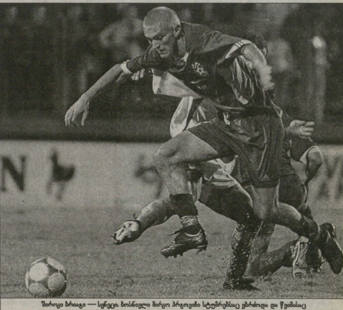
შორეი ბიათე — სენეცა ბონილი მაციო პრეოვიბი სტურტებზეც ცხობი და წვიბასე