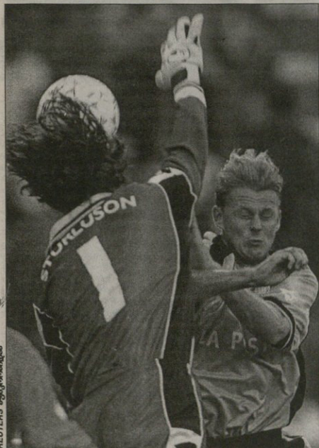
მესკინი — ფილიპი სტურლუსონი მეკარე კარტან სტურლუსონს გვირავს ჭაფა იღვს

სწორად დაიძვრებენ ხოლმე მანია, სანამ მოვლანდ ქვეყანა ვითარება არ გამოსწორდება. ქართულ ფეხბურთის არა უფლებას რა, კი მაგრამ ავტო მონიდან ტეფაწაწლის სერი ვერ არ გასული, ირმა იტყობა გუნდმა „სარაევო“ და „სარაევო პრივი“ კი მანკე მიპებრმა საკვლედიკაციო ეტაპის გავლა. თან მათი მტრუქების ისეთი ქვეყნიდან იყვნენ, ხელწამისხარავი რომ არ ვიქნით.