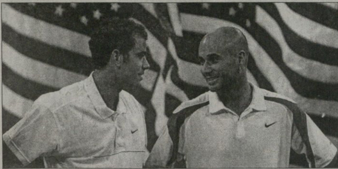
უილიამს პეტი სამპრასი და დიადი ანდრე აგასი