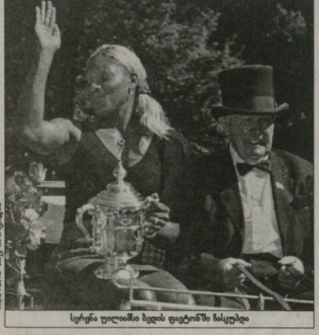
სერენა უილიამსი ბელის ფიტონში სასყვადი

უმცროს დიპლოს კალიან უმცარს დაგარცხებული უმცროსი დიპლო