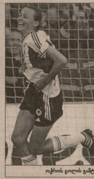
ოქროს გოლის გამტანმა გერმანელმა კლაუდია მიულერმა ჭერ გაიხარა, მერე გაიხარა

ბმა 3:1 მოიგეს. ამ თამაშში ორი გოლი კლაუდია მიულერმა გაიტანა. საერთოდ ტურნირის სუთივე თამაში, დიდებულად ჩაატარეს გერმანელებმა, თორმეტი გოლი გაიტანეს და საკუთარ კარში ერთი გაუშვეს. ფინალამდე ოლიმპიური ჩემპიონები ნორვეგია დაამარცხეს 1:0. შვედთა დამრიგებელმა მარია დო-მანსკი-ლიფომ აღიარა, ფინალში ჩვენ უკეთესად გამოვიყურებოდით, მაგრამ ანგარიში ვერ გავხსენით, რადგან გერმანიას საუკეთესო დაცვა და ნახევარდაცვა ჰყავდაო. გერმანელები მეოთხედ განდნენ ჩემპიონები. ადრე 1991, 1995 და 1997 წლებში მოიგეს (1995 წელს ფინალში შვედები დაამარცხეს). ამ გამარჯვებისთვის თითოეული გერმანელი ფეხბურთელი ცხრა ათასი მარკით დასაჩუქრდება.