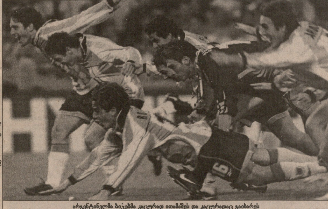
არგენტინელმა ბიჭებმა კაცურად ითამაშეს და კაცურადაც გაიხარეს