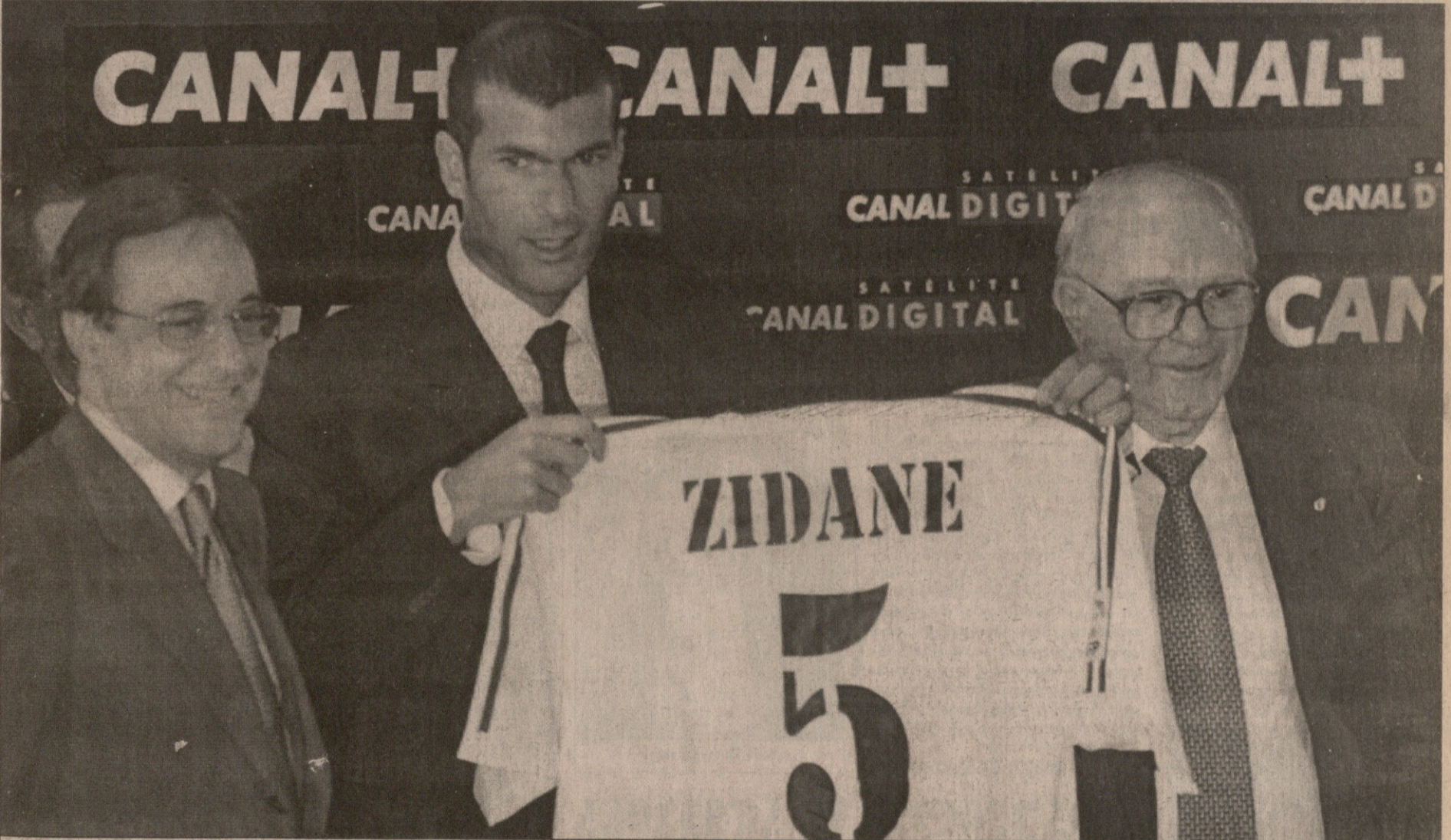
გუშინ „რეალის“ ორმა პრეზიდენტმა, რეალურმა და საპატიომ, ფლორენტინო პერესმა (მარცხნივ) და ალფრედო დი სტეფანომ საზოგადოებას წარუდგინეს მსოფლიოში ყველაზე ძვირადღირებული მოთამაშე, 64,45 მილიონ დოლარად შეძენილი ზინედინ ზიდანი