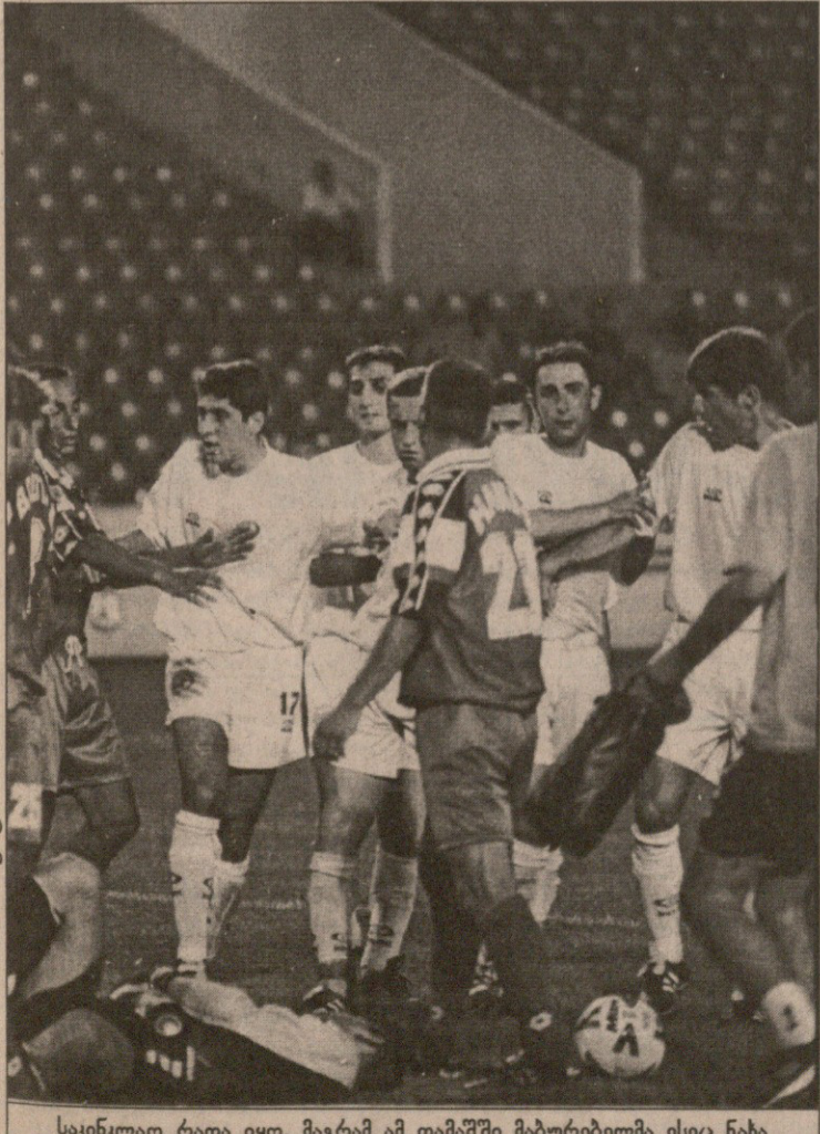
საყინელო რაღა იყო, მაგრამ ამ თამაშში მამურებელმა ესეც ნახა