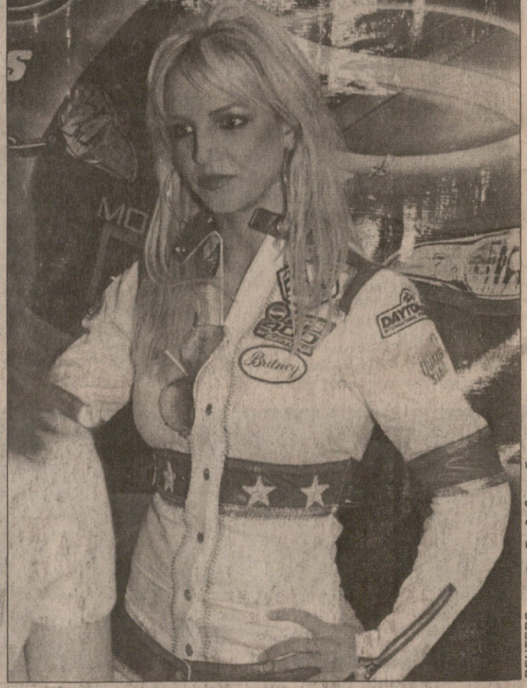
დაიტონა ბიჩიდან