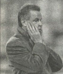
ნუ დარდობ გოგონა, ჰაიერნს ოცი წელი მანერ, ვერავინ დაუნუა. თქვენი კი, ჰერ ოტმარ, ბავშვებს ნუ ატირებთ, ჩემპიონთა ლიგაში მოგება დაინწყით

ვერ მისდის კარგად საქმე მიუნხენის „ბაერნს“ — დიდი მანისა, ცოტა ხანში ჩემპიონთა ლიგადან უეფას თასზე გადაინაცვლოს. არადა, შემადგენლობა ჰყავს... თუმცა ამ წერილის აზრი არც ოტმარ მიცველდის კრიტიკა და არც მინი-კრიზისიდან გამოსავლის ძიება. უზარალოდ გვირდებ, ამ გუნდის ჩვენებურ გულშემატკივრებს გამოუყვეთით ხასიათი და გერმანული ბუნდესლიგის ყველა დროის ცხრილი წარმოგიდგინოთ: სამშობლოში „ბაერნს“ კონკურენტები არ ჰყავს და უახლოეს ათწლეულებში არც ეყოლება. და ეს იმის მიუხედავად, რომ მიუნხენური კლუბი 1963 წელს ჩამოყალიბებული ბუნდესლიგის ოდნავ მოვიციანებით შეუერთდა და მეორე ადგილზე მყოფ „შაიბურგს“ ორი ვადენილი სეზონით ჩამორჩება.