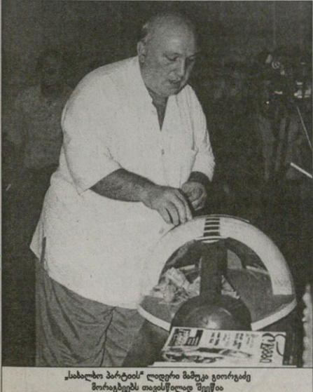
სახალხო პარტიის ლიდერი მამუკა ვიორჯიძე...