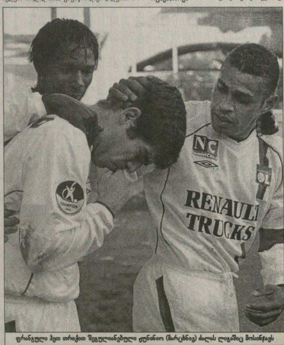
ფინანსი ბეი თორბი შეველიანბული ეწინობი (მარტენბი) მისას ლევიეცეც მოსინეცეც