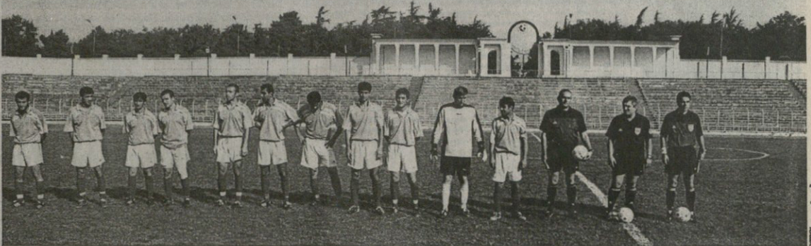
რუსთავეის „გორდა“ „მერანს“ აზარდ ელოდა