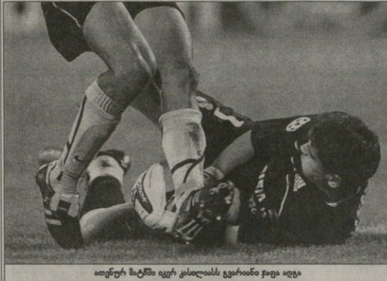
ათენურ მატჩში ივრა კასილიას გვარამია ჯაფა აფეა