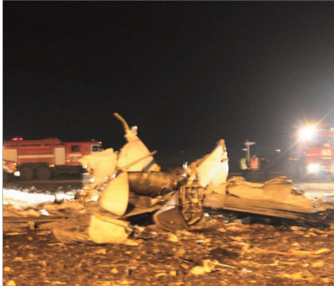
გაზრდილობა 80-4 გვარდუა

კვირა საღამოს ყაზანის აეროპორტში დაშვებისას კატასტროფა განიცადა ავიაკომპანია «ტატარსტანის» კუთვნილმა ავიალაინერმა «ბოინგ 737-500»-მა (საბოლოო ნომერი VQBBN), რომელიც მოსკოვის აეროპორტ «დომოდედოვოდან» ყაზანში მიფრინავდა. დაიღუპა ავიალაინერში მყოფი ყველა ადამიანი - 44 მგზავრი და ეკიპაჟის 6 წევრი. თვითმფრინავის ავარია მოსკოვის დროით 19:25 საათზე მოხდა.