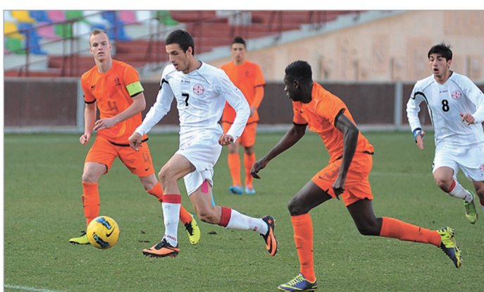
გაზრდილობა 80-8 გვარდუა

საქართველოს 19-წლამდელ ფეხბურთელთა ნაკრებმა «ლოკომოტივის» სტადიონზე ჰოლანდიის ნაკრებს უმასპინძლა და 2:1 მოუგო. ევროპის ჩემპიონატის შესარჩევი ეტაპის ეგიდით გამარ-