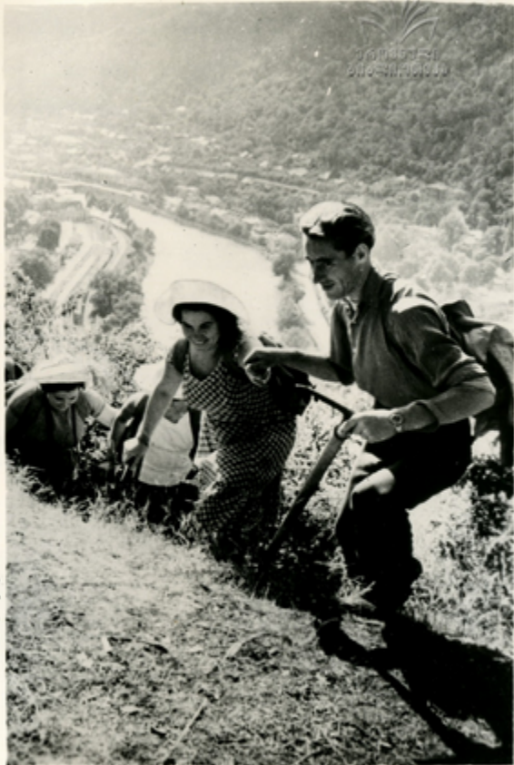
ՅՈՒՆԵՍԿՕ ԶՈՒՄԸ ԿՐԿՈՒՄ.

ԸՆՆՎԵՑՈՒՄ ԵՄԸՆՈՒՄ ՆԱԶԳՐՄԻ ՎԵՐՈՒՄԸ ԶԱՅՄՈՒՆՈՒԹՅՈՒՆ ԵՎ ԶԵՆՈՒՄ. ԻՉԵՆ ԺՅՎՅԱՆՅՈՒ ՎՈՒՆ ԱՆՈՒՄ ԴԱՏԵՎՈՒԹՅՈՒՆ ԿՐԿ. ՈՒՅՈՒ ԶԵՆՈՒՆԻ ԿՐԿՈՒՄԸ, ՆԱԸՄ ԶՈՒՄԸ ԿՈՆՎԵՐՏԻ ԸՆՆՎԵՑՈՒՄ, ԶԱՅՄՈՒՄ ԴԱՏԵՎՈՒԹՅՈՒՆ. ԶԱՅՄՈՒ ՆԵՐՁՆԱԿՐՈՒՄԻ ՄԵՂՈՒՆ ԿՐԿՈՒՄԸ ԶՄՆԱԿՄՈՒ ՑՈՒՆՑՎՈՒ ԸՄԿՐՈՒՄ, ԶՄՈՒՆՈՒՄ ԶՄՆՈՒՄ ՎԵՐՈՒՄ.