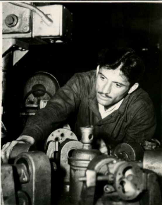
ՄՈՒՆԻՏՈՐՆԵՐ ԶՈՒՄՆԸ ԸՅՅՅԿԱ- ՆՈՒ և ՅԵՅՎԵՆԻԿԱՅԸ:

Նրանցից յսուկացան ՆԵՎԷ- ՅԱՆԿԱՆ ՁԵՄԵՑԻ ՅԺԸՆԿԱ ՆԱԶ- ՅՈՒԿԱԿՆ ՆԱԶՄԱՅԱՅԱՆՆԵՆՆ, ԿՐԻՍ- ԼՍՈՒՆ և ՄԱԿՄՈՒՆԻՈՒՆՆ ՆԱԵՎ- ԸՄՈՑԻՆ ՎԵՏՈՒՆՆԻՆ, ՆԱՎԱԶՄԱԿ- ՅՈՒԿԱՆ ՎԱԿՆԱՆԵՑ ՁԵՄՈՎՅՅՆԱ: ԵՄ- ՏՆԱՎԵՐԸ ԿՈՒՐ ԵՎԵՏ ՁԵՄ ՁԵ- ՎՆԻԸՆԻ ՆԱԿԱԿՈՒ ՆԱԵՑԵՑԻ: ՆՈ- ՔՅԱԿԵՄԱ ՄՈՒԼՄՈՆ ՆԱԵՑԵՑԻՆ ՄՈՒՆԻՏՈՐՆԵՐ-ՆԱԵՎԵՅԱՆԿԸԸԸՁԸ ՅՈՒՅՆԵՐԵՑ, ԿՐԻՍՏԵՆԱՍ ԿՈՅՆ ՎԵՐԿԱՆԻՑՆԻԸ ԵՎԵՐԿՆԱՅԱՆ- ԸՄՈՑ, ՅՈՒԿԱՆ ԸՎԸՄ ԼՅՅՅ ՄՄԻ ՎԿՐԸՄՈՆԻՆ ՅԱՆՆԵՆՆ, ԸԼՆԵԱԿՈՒ- ՅՈՆ ՑԵՆԱԿԱԸՄՆ 10 ԺՅՈՆ ԿՐՄ- ՅԿԱՅՁԱ: ԵՄԿԱՅԵՆ ՆԱԿՈՒԿԱՆ ՆԱԿԱՆՆԵՑ ԹՄՄԿԱՅԻՆ ՆԱԵՑ- ՅԿԱՆ ՄՈՒՆԻՏՈՐՆԵՐԻ ԹԿՈՒՄԻՆ ԸՅՅՅՅԿԱԸՆ ՁԵՎԱՆ ՁԵՅՎԵՆԻԿԱՅԸ: