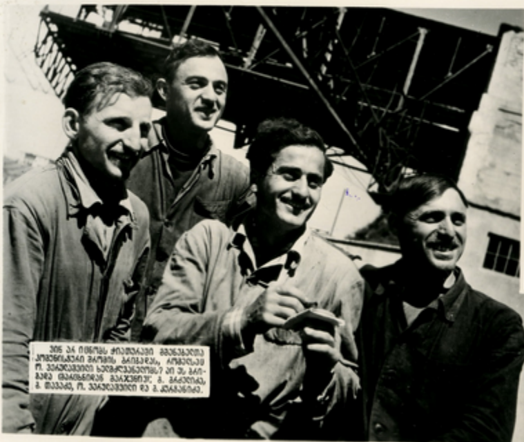
305 24 08678 მ- ურანდისი მანდანი, მანდანი, მანდანი მანდანი მანდანი მანდანი, მანდანი მანდანი მანდანი მანდანი, მანდანი მანდანი მანდანი მანდანი, მანდანი

საბჭოთა ახალგაზრდობა ახმანას ინდუსტრიის მიზანშეწონი, მუშაობს ჩვენს ქვე- ენს ზანაზანიონ სიბერიის ანსტრუქსიანად. ეს სანდომანი, უაღრესი ზადრისი მანად ჯნა ურედ ჩვენს ურანდის ხმდრის დედანი. ურანდისი ახლ მუშობან ურანს ან მსხვილ ახლმდრისმან, რმდრისან ხდის დანკრითს ურედანს. ერთი მთხანიე მ- თნადანი, მანდრის მანმანდის მანად მანდანი.