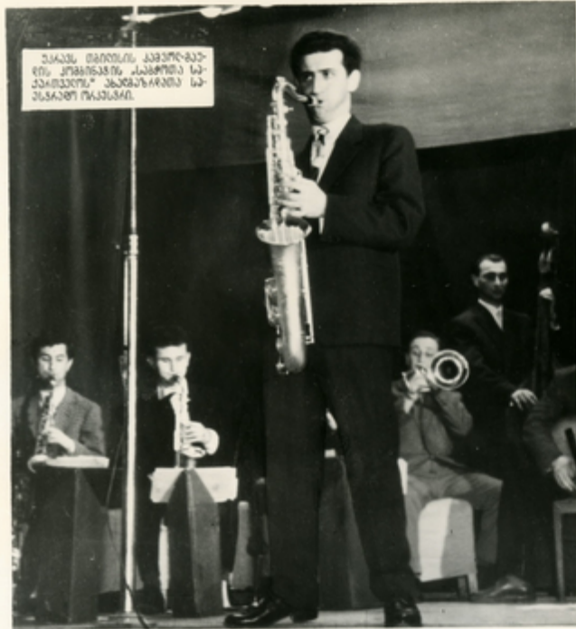
ՀԱՅԱՍՏԱՆԻ ՄԱՅՈՒՆԻՆ ԿԱՅՈՒՐ-ՃԱՅՐԻՆ ԳՐԱԳՐԱԿԱՆՈՒԹՅԱՆ ԿԱՆՈՒՅՈՒՄԻ ՆԱԽՅԱՆՆԵՐԻ ՆԱԽՆՆԱԿԱՆ ԿՈՆՍԱԿՐԻ ԴԱՆՆԱԿԻ: