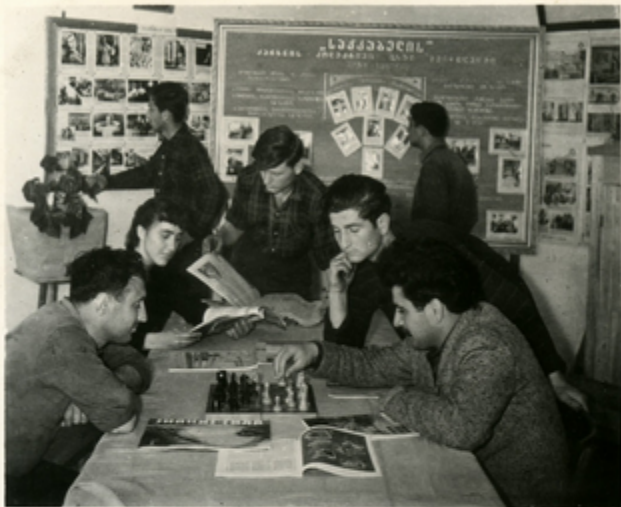
მეცნიერულ კლასში ჩატარებული სეზონის დასრულების შემდეგ მოსწავლეები.

საქართველოში ახალგაზრდობის განვითარებისათვის ახალი გზების მოძიება, რითაც კეთილი სულები, კვლევა, კვლევითი მუშაობა და სწავლება.