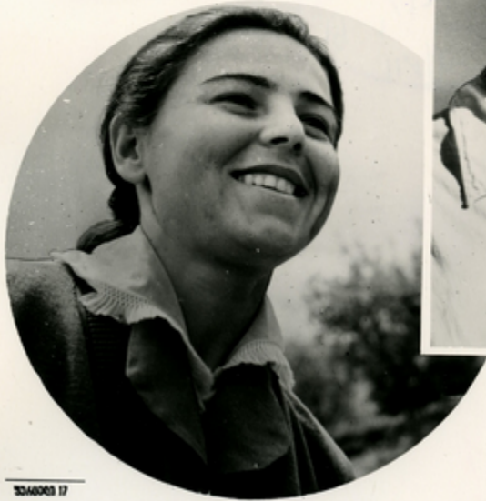
მინიღონ ახიჭონ სოფელ მანს- გის კომპანიაკადემათ მშენებელი მინიღადა.