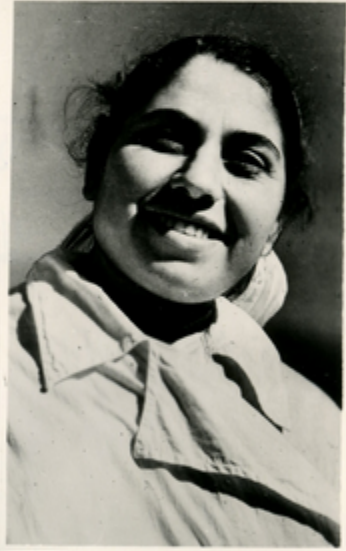
საღმნიჭონ მინიღადა-მინიღ- მინიღის სანაღმოს მინიღადა- მინიღის კომპანიაკადემათ მინიღის მინიღის მინიღადადა მ. მინიღ- მინიღის.