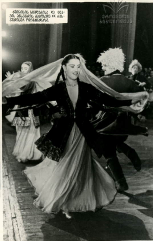
ՃՅՈՒՆԻՆԻ ԿՈՆԿԱՐՏԻՆ ԸՆ ԵՍԿՐՈՒ ՆՆԱԽՅԱՆԻՆ ԿԱՅՈՒՆՅԵՐ ԻՎ ԿՅՆՆԱԿԱՆԻ ԴՐՈՒՄՈՒՆԵՐՆ: