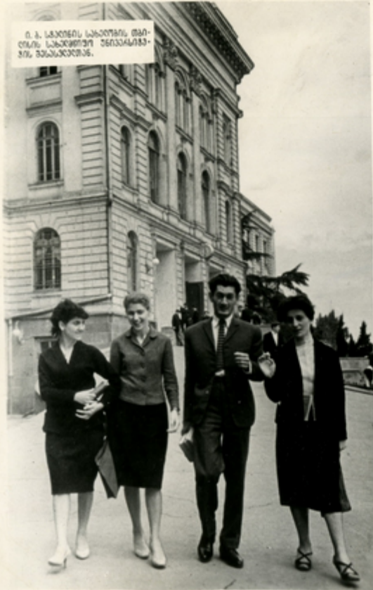
Ո. Ա. ԼԱՅՈՒՐԵՆԻ ԼԱՅՈՒՐԵՆԻ ԹԱՌՈՒՆ ԼԱՅՈՒՐԵՆԻ ԾԵՂՆԱԿԱՆՑՅՈՒՆ ԾԱՌԱՅՈՒԹՅԱՆ ԿԵՆՏՐԱԼՆԱԿԱՆՑՅՈՒՆ: