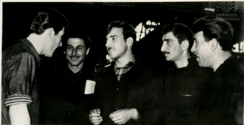
ՄՈՒՆԻՏՈՐՆԵՐ ԶՈՒՄԱՅ, ԿՐԻՍՏ- ԼՍՈՒ և ՏՆԱԿՆՈՅՑՆԻ ԵՅԵՐԿՆ- ՆՈՐԱՆ:

Նրանցից յսուկացան ՆԵՎԷ- ՅԱՆԿԱՆ ՁԵՄԵՑԻ ՅԺԸՆԿԱ ՆԱԶ- ՅՈՒԿԱԿՆ ՆԱԶՄԱՅԱՅԱՆՆԵՆՆ, ԿՐԻՍ- ԼՍՈՒՆ և ՄԱԿՄՈՒՆԻՈՒՆՆ ՆԱԵՎ- ԸՄՈՑԻՆ ՎԵՏՈՒՆՆԻՆ, ՆԱՎԱԶՄԱԿ- ՅՈՒԿԱՆ ՎԱԿՆԱՆԵՑ ՁԵՄՈՎՅՅՆԱ: ԵՄ- ՏՆԱՎԵՐԸ ԿՈՒՐ ԵՎԵՏ ՁԵՄ ՁԵ- ՎՆԻԸՆԻ ՆԱԿԱԿՈՒ ՆԱԵՑԵՑԻ: ՆՈ- ՔՅԱԿԵՄԱ ՄՈՒԼՄՈՆ ՆԱԵՑԵՑԻՆ ՄՈՒՆԻՏՈՐՆԵՐ-ՆԱԵՎԵՅԱՆԿԸԸԸՁԸ ՅՈՒՅՆԵՐԵՑ, ԿՐԻՍՏԵՆԱՍ ԿՈՅՆ ՎԵՐԿԱՆԻՑՆԻԸ ԵՎԵՐԿՆԱՅԱՆ- ԸՄՈՑ, ՅՈՒԿԱՆ ԸՎԸՄ ԼՅՅՅ ՄՄԻ ՎԿՐԸՄՈՆԻՆ ՅԱՆՆԵՆՆ, ԸԼՆԵԱԿՈՒ- ՅՈՆ ՑԵՆԱԿԱԸՄՆ 10 ԺՅՈՆ ԿՐՄ- ՅԿԱՅՁԱ: ԵՄԿԱՅԵՆ ՆԱԿՈՒԿԱՆ ՆԱԿԱՆՆԵՑ ԹՄՄԿԱՅԻՆ ՆԱԵՑ- ՅԿԱՆ ՄՈՒՆԻՏՈՐՆԵՐԻ ԹԿՈՒՄԻՆ ԸՅՅՅՅԿԱԸՆ ՁԵՎԱՆ ՁԵՅՎԵՆԻԿԱՅԸ: