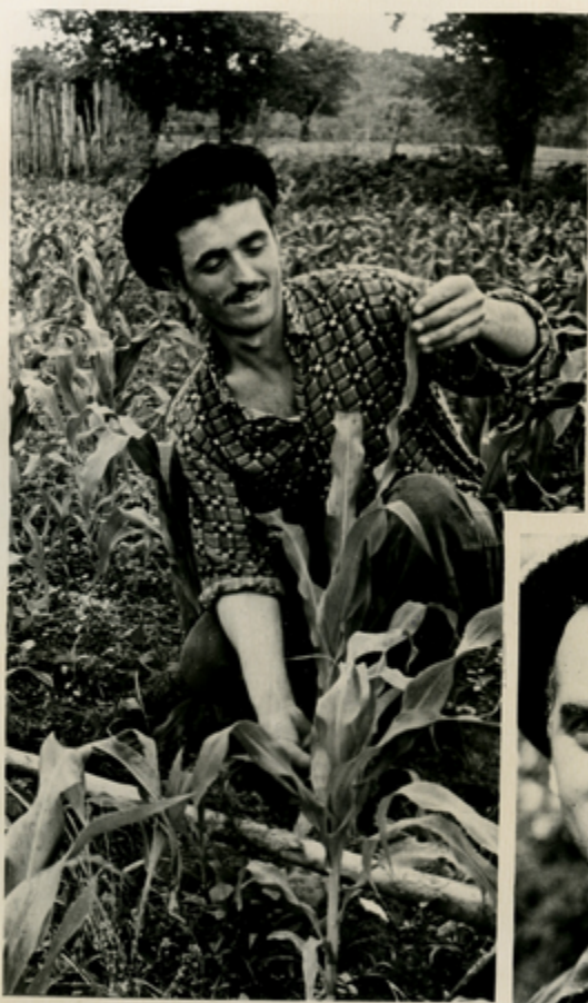
კარგი მუშაობით მრავალწლიანი მამუცხევილი.

მედი მამუცხევილი — მრავალწლიანი — ასეთი უჩინო მუშაობით ახსნის საქართველოს სხვადასხვა რაიონის სოფლებს. მისი მუშაობის შედეგად მრავალი სოფელი აღდგა და მრავალი ახალი სოფელი შეიქმნა. მისი მუშაობის შედეგად მრავალი სოფელი აღდგა და მრავალი ახალი სოფელი შეიქმნა.