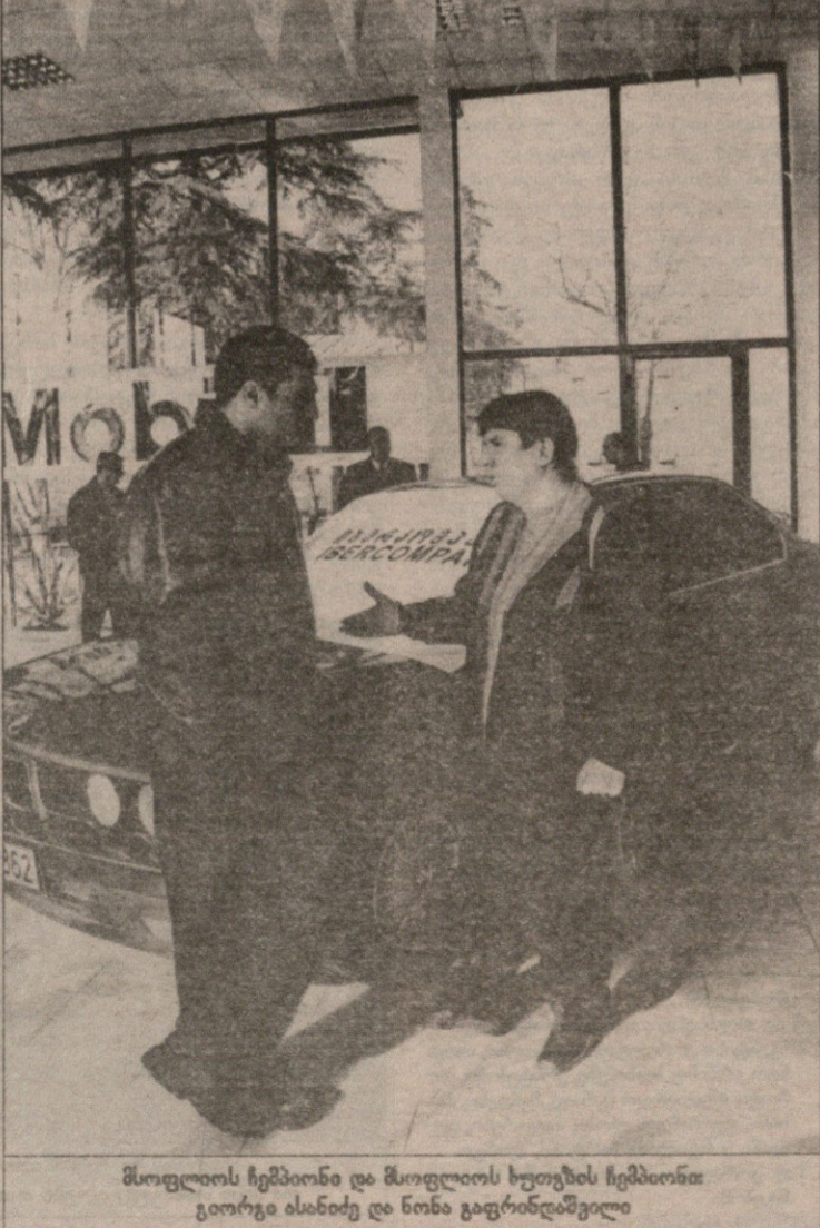
მსოფლიოს ჩემპიონი და მსოფლიოს ხუთჯამის ჩემპიონი გიორგი ასანიძე და ნონა გაფრინაშვილი