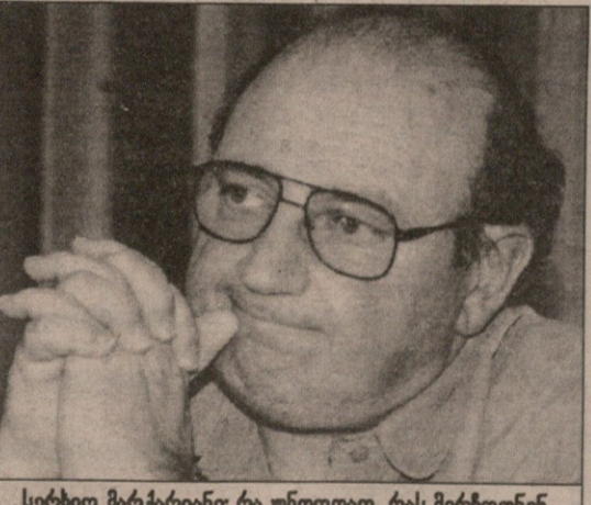
სერხიო მარქარიანი: რა უნდოდათ, რას მერჩოდნენ