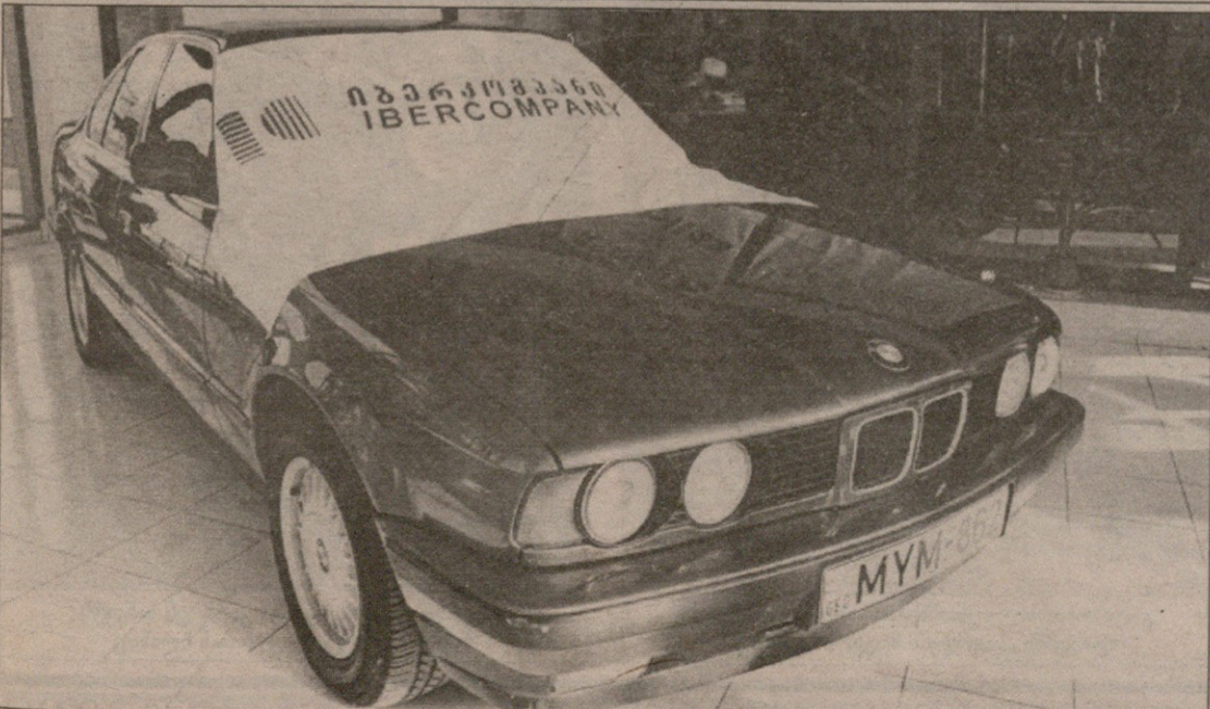
„იბერკომპანის“ ნაჩუქარ BMW-ს ბედი ჰქონია: მის საჭეს მსოფლიოს ჩემპიონი გიორგი ასანიძე მიუჯდება