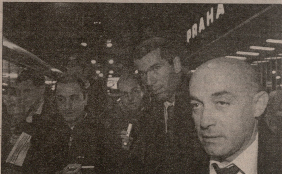
პრადის აეროპორტში ყველაზე მეტი ხალხი რეალელთაგან ზინედინ ზიდანს შემოეგება

მადრიდის „რეალი“ „სპარტა-ზე“ გაცილებით მაღალი დონის კლუბია, მაგრამ ესპანეთის ჩემპიონი ჩეხურ გუნდს სათანადოდ აფასებს და მასთან გასვლით მატჩში იოლ გასივრებას არ ელის. ეს ჩვენი ვარაუდი არ არის, ივან ელგერაც აღასტურებს — პრადამი ორი დღით ადრე იმიტომ ჩამოვედით, რომ მეტოქის შესაძლებლობებზე წარმოდგენა შევიქმნათ და რაიმე ლაფსუსებისგან თავი დავიზღვიოთ — განაცხადა ვერობის წლის საუკეთესო ფეხბურთელის ნომინანტა შორის მოხვედრილმა ესპანელმა. „სპარტასადმი“ მორიდებულობა „რეალის“ სპორტულ დირექტორ ემილიო ბუტრაგენიოსაც ეტყობა: „ჩეხებს ძალიან კარგი გუნდი ჰყავთ. ისიც ცხადია, რომ ჩვენს წინააღმდეგ გათმობებული ენერჯით ითამაშებენ. „რეალთან“ ყველა თავის გამოჩენას ცდილობს“. ისიც ვთქვათ, როგორ ითამაშეს „რეალი“ და „სპარტა“ თავიანთი ჩემპიონატების ბოლო ტურში. ესპანეთის ჩემპიონმა 2:1 მოიგო, ხოლო ჩეხეთისამ 1:1 მატჩში პირველი მარცხი იწვნია — 1:2 წაგო. „სპარტას“, ალბათ, ორი მოთამაშე დააკლდება — მცველი ზდენეკ გრიგერა და თავდამსხმელი ლუკას პარტივი. ამის მიუხედავად, ჩეხთა თავკაცს, იაროსლავ პრეხის ცოტათუნობტიზმიში შერჩენია და აცხადებს: „რეალურად ძალიან მკიერ შანსია იმისა, რომ მოვივებთ, თუმცა მის გამო-