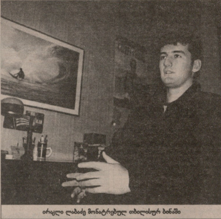
ირაკლი ლაბაძე მონატრებულ თბილისურ ბინაში

საქართველოს ნომერ პირველი ჩოგბურთელი ირაკლი ლაბაძე ორიოდ თვის წინ არც მსოფლიოს მასშტაბით იყო ურიგო „ვილას“. პირველად კარიერაში ჩოგბურთის რანგთა ტაბელის მოწინავე ასეულში შეიჭრა, 99-ე ადგილზე, ხოლო შანხაის ტურნირის შემდეგ ერთ-ერთი იმპოტანია, რომელთაც აგასის დამმარცხებლის სტატუსი მოუბოვებიათ. ირაკლი თბილისში რამდენიმე დღით ჩამოვიდა (ახლა იგი უკვე გერმანიაშია) და ინტერვიუც მამინ შედგა.