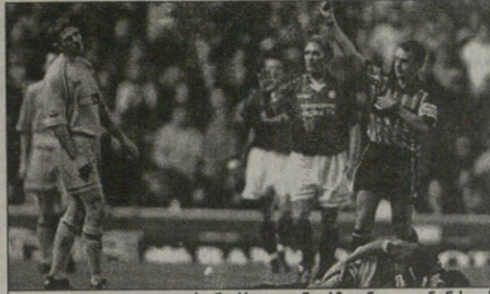
რეინერსი — დანერბლიანი, კალანონის გამცემის მტერ სტუმრებს შოთა ირეცავს და მისი თანაურდლები ვერ გაატრეს