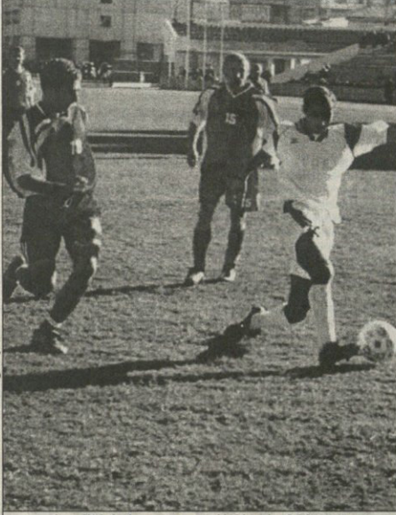
ბათუმი 1:0 ვიბაღურში (პროგრამა 66) ტელეფონი, დარბაზი, უფასო მისაღები (ტელეფონი 66) & მისთვის (ტელეფონი 80) საავიარსებო პროგრამა საავიარსებო ტელეფონი 0934026023 მისამართი

ბათუმი 1:0 ვიბაღურში ბათუმი 1:0 ვიბაღურში (პროგრამა 66) ტელეფონი, დარბაზი, უფასო მისაღები (ტელეფონი 66) & მისთვის (ტელეფონი 80) საავიარსებო პროგრამა საავიარსებო ტელეფონი 0934026023 მისამართი ბათუმი 1:0 ვიბაღურში (პროგრამა 66) ტელეფონი, დარბაზი, უფასო მისაღები (ტელეფონი 66) & მისთვის (ტელეფონი 80) საავიარსებო პროგრამა საავიარსებო ტელეფონი 0934026023 მისამართი