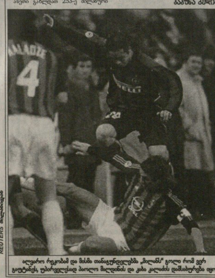
აფიკრი რეკონსტრუქციის მუშაობის და მისი თანაურდლები გაბრუნების უპირველესად მალი მდინდის და კასი კალდის დამსახურება იყო

კონსტიტუცია კალი, მესტავი, მელიკო, კ მური, ნაშინი, რიქინი, ბ. ფერაფონი, არბიტა, მ. პანდინი, მელი (მ. ფი ელი 90), მ. მაკანი (ტურა 7)