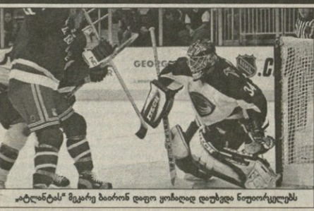
„ატლანტის“ მჭერე ბაირონი დილო ყომალი დილოდა ნიორაკელებს