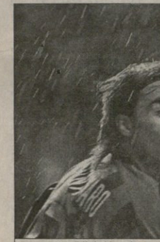
ალან შორეისა ფიჭობი კანაგარის შამბინტაბული ჩასხვით

რატომ ორნაც და „პარსელონს“ გაუხსენიათ, რომ 1992 წელს სწორედ „უეზლის“ მოთავსა „მარსამ“ თავისი ისტორიამი პირველი და ჯერჯერობით ერთადერთი ჩემპიონია თავის და კატალინიელთა ინტერესაც ნაივლი გახდება. ოღონდ დეკლარებით, რომ პაბლო ორნაც ეს ცვლავეერი თავისი ხარეტი შეიძინა საკუთარი კოლეგეისთვის და „აპს ნოუზ“ არსებულ „პარსელონს“ მუხტუს (12 მატჩიანი დამთავლებული წელთაღებში) მხოლოდ დროითი ათისთვის. ცხადია, სურია რამ ათად ინტელიდან დანა პრესტიჟთან არსებულ ფეხბურთის მუხტუსი გამოითქვას 1948 წლის ოლიმპიური თამაშების ჩინადაც, ამავე ოლიმპიის ჩემპიონია ოქრის მემორიალი დაფა და ის მუღო, რომლისაგან ასხლებლბდა ბურთისა