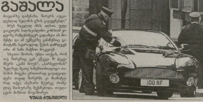
სხვათა შორის, უნდა თქვას, რომ თუ შორეიც ვერ ენებოა 10 დეკემბრის „აპს ნოუზ“, „პარსელონის“ უფიხედ მათე სარემონტოლორ თამაშს მოგება გრითორად გაუადვილდება თავად შორეისა კი მაიმეტე-რად თქვა, ამეზანი შორეიც რომე-რაც მაისურაც შექმნებოდა, თავდაცვის მხარით მოეპოვო.

გაზუთ „სანის“ ფოტორეპორტიორებს ხომ არაფერი გამოეპარებათ. აი ახლაც, მანჩესტერის საგზაო პოლიციის ორ თანამშრომელს მასონ „ჩააგულეს“, როცა ამათ ერთ-ერთ მალაზიაში საყიდლებზე შესული რიო ფერდინანდის მანქანას „მანჩესტერი იუნიტიტეში“ ტრავმირებული მცველის 160-ათას გირვანქიანი „ასტონ მარტინი“ 25 სანტიმეტრით იყო გადმოშორებული დასაშვებ ზოლს. ნუ ჩათვლით, რომ მსოფლიოს უფიციეს მცველს თავში აუფარდა. უბრალოდ, მისი მანქანა უფრო განიერია, ვიდრე გასაჩერებლად გამოყოფილი ალაგი. ფართო მანქანის პატრონს ჯიბეც ფართო აქვს — 40 გირვანქა ფარმის გადახად კვირში 70-ათასის მშვენიერ რიოს ნამდვილად არ დაახარალებს.