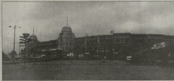
„უეზელი“ მთელ მსოფლიოში გაიყიდა

უკანასკნელი მატჩი ჯერ გამართულიც არ იყო, როცა ინტერნეტში აუქციონის ონლაინი გაიხსნა — იყიდება „უეზელი“, ნაილ-ნაილ და იაფად ეს 2000 წლის ავსტრალიის მოხდა, სე-ქტემბერი კი დიტიმარ პამანა დედო სიმენს შორიდან გაუტანა, გერმანია კიჯანის ინგლისი 1:0 დაამარცხა და ლევენდარული „უეზელი“ სტადიონზე დაიხურა