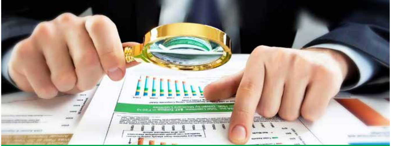
სკანდალური დასკვნა – სახელმწიფო აუდიტი მუნიციპალიტეტებში განხორციელებული ინფრასტრუქტურული პროექტებით დაინტერესდა

„2019-2020 წლებში, ზედამხედველ კომპანიებს ადგილობრივი ბიუჯეტიდან, ჯამში 39 036 400 ლარი აუნაზღაურდათ ისე, რომ მუნიციპალიტეტებს სათანადოდ არ შეუმომნებიათ, რამდენად ასრულებენ მიმწოდებლები ხელშეკრულებით ნაკისრ ვალდებულებებს. ყველა მუნიციპალიტეტის მასშტაბით, სამშენებლო სამუშაოების საზედამხედველო საქმიანობის ტენდერებში გამარჯვებულ პრეტენდენტებს, ჯამში, წარდგენილი აქვთ 1 143 პირის მონაცემი, რაც სრულად აკმაყოფილებს სატენდერო პირობებით მოთხოვნილ გამოცდილებასა და კვალიფიკაციას. დოკუმენტაციის შესწავლით კი დასტურდება, რომ პროცესში ჩართული იყო 847 ზედამხედველი, რომელთაგან მხოლოდ 327