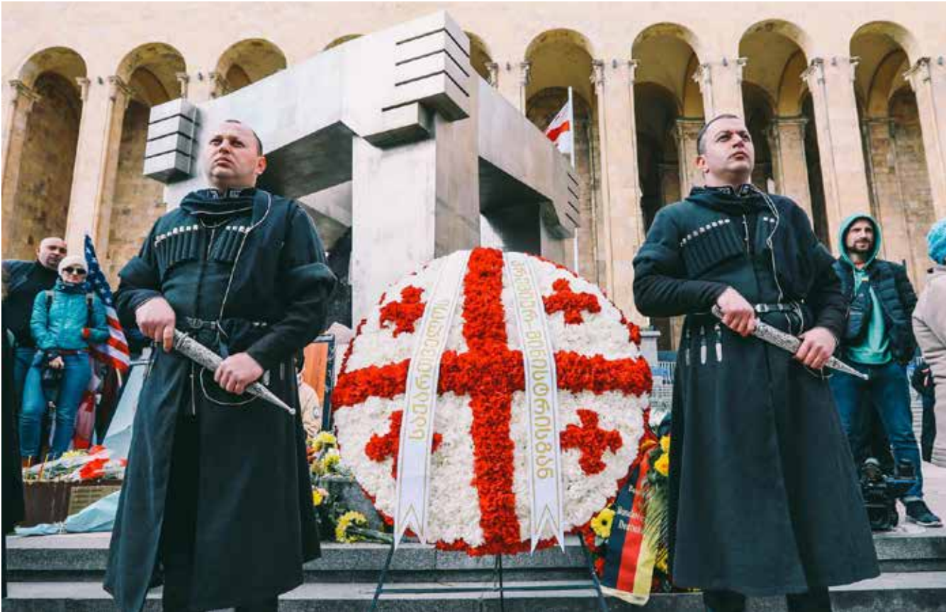
შინაგან საქმეთა მინისტრი, ვახტანგ გომელაური, პრემიერ-მინისტრი ირაკლი ღარიბაშვილთან და მთავრობის წევრებთან ერთად, რუსთაველის გამზირზე, 9 აპრილის მემორიალთან მივიდა. ვახტანგ გომელაურმა მემორიალი ყვავილებით შეამკო და 9 აპრილს დაღუპულთა ხსოვნას პატივი მიაგო. 9 აპრილის ტრაგედიიდან 33 წელი გავიდა.