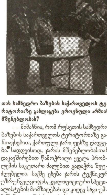
პრინციპული ურთიერთობები... ეკონომიკის განვითარება...