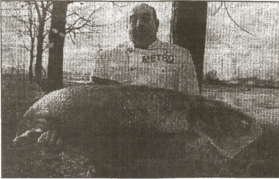
144-ე ნომერი გამოქვეყნებული ფოტოსურათის მკითხველისეული მასათაურება