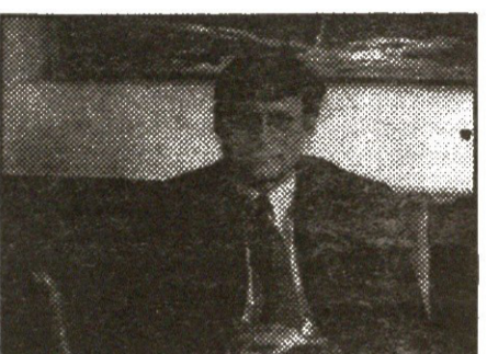
საქართველოში ეკონომიკური მდგომარეობის გასაუმჯობესებლად მართებული გზა აირჩია. ეკონომიკური რეფორმის გარეშე შეუძლებელია კრიზისის დაძლევა.

ვიჩინა. რაც შეეხება საგარეო ვალდებულებებს, ეს პრობლემაც სწორედ მათი თანდაცობით გადაწყდა — მოვახერხეთ ვალის ნახვერის გადახდა, რაც უდაუყო დიდი მიღწევაა.