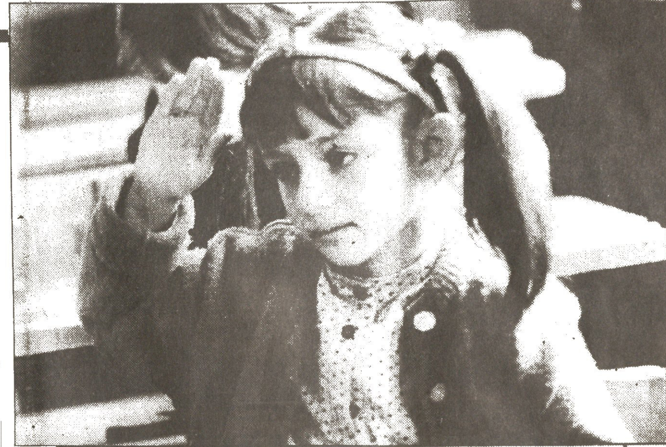
„ქაწვილი უნდა სწავლობდეს სწავლობდეს თავისდაბო, ვინ არის, სიდიდ მოსულა, ხელ არის, წავა საბო!“

მინდა, უპირველეს ყოვლისა, შედეგად, მოსწავლეებს, სტუდენტობას და მთლიანად საქართველოსაც მივულოცო ასალი სასწავლო წლის დაწყება. ვინააბთ სნაპლას, ესე იგი — ვინააბთ ნორმალურ ცხოვრებას! წლებადელო წელი რეფორმათა ნელია, რომელიც დაგვირგვინა პოლიტიკური რეფორმის ფუძემდებლობა დოკუმენტმა — კონსტიტუციამ. ამ კონსტიტუციაში თავისი კუთვნილი ადგილი დაიკავა ადამიანის უფლებათა შორის ერთ-ერთმა უმნიშვნელოვანესმა — უფლებამ სწავლაზე. პარლამენტმა მოამზადა განაოლებების კანონი, მინისტრთა კაბინეტი იღებს განაოლების რეფორმის პროგრამას, განაოლების სამინისტრო დაამტკიცა განაოლების კონცეფცია. ეს ნორმატიული აქტები არსებითი განაოლების სისტემის მიზანმიმართული და შეუფერხებელი საქმიანობისთვის, მაგრამ თვით ყველაზე კარგად შედეგები კანონი და პროგრამა შეიძლება მხოლოდ ქალაქებ დარჩეს ამ ფარგლებს შორის არ იყოს, თუ მას ფარგლებს შორის არ იყოს. განაოლების რეფორმის უპირველესი ნორმის შემსრულებელი თქვენ ბრძანებით — მასწავლებლები, ლექტორები, აღმზრდელები... როგორ შესახება ამ ფონზე განა-