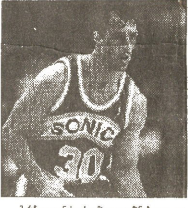
ბარნოვისი მისი დადგენილი და განარტული ფორმა...