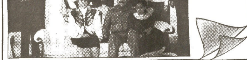
სისხლიანი ორბიები ერაყში. სისხლიანი ორბიები ერაყში.

სისხლიანი ორბიები ერაყში. სისხლიანი ორბიები ერაყში. სისხლიანი ორბიები ერაყში. სისხლიანი ორბიები ერაყში. სისხლიანი ორბიები ერაყში.