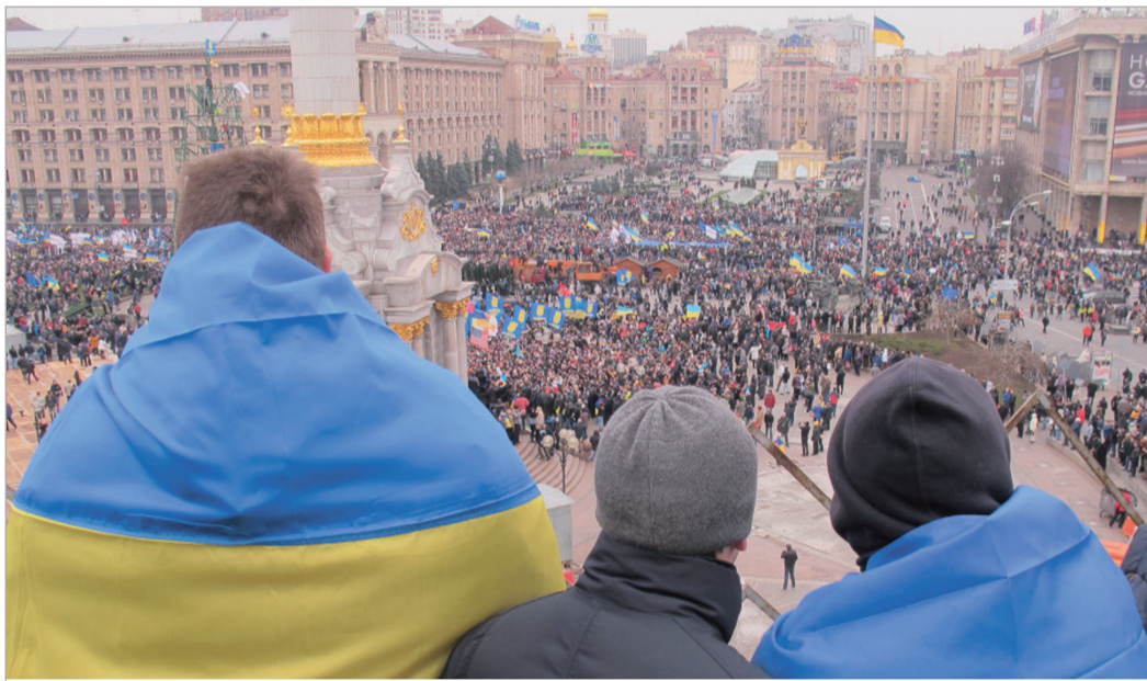
ბაზრძალაბა 80-4 გვარდუა

გასულ შაბათ-კვირას უკრაინაში მდგომარეობა უკიდურესად გამწვავდა. იანუკოვიჩის მთავრობის უარს - ვილნიუსის სამიტის დროს ხელი მოეწერა ევროკავშირთან ასოცირებისა და თავისუფალი ვაჭრობის შესახებ ხელშეკრულებებზე, დამატებით ევროინტეგრაციის მომხრეთა აქციის სასტიკი დაბევა, რამაც ხალხის მასების უკიდურესი აღშფოთება გამოიწვია.