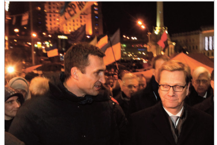
ვიტალი კლიჩკო და გვიდო ვესტერველე „მაიდანზე“

კიევი ევროინტეგრაციის მომხრეთა საპროტესტო აქციები გრძელდება და შეიძლება ითქვას ფართოვდება კიდევ. ოპოზიციამ მოახერხა უმაღლესი რადას მორიგი სხდომის ჩაშლაც, რადგან პარლამენტი სამშაბათს არ დათანხმდა მთავრობისთვის უნდობლობის ვოტუმის გამოცხადებაზე.