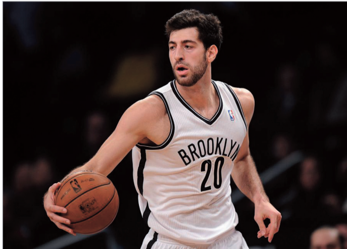
ბაზრქაძეა მე-8 გვერდზე

რიგებში მეტ სათამაშო დროს აძლევენ. ასე იყო „დენვერ ნავისთან“ საშინაო შეხვედრაშიც, სადაც ქართველმა ფორვარდმა მოედანზე 17:39 წუთში მიმდინარე სეზონში მისთვის სარეკორდო 7 ქულას მოუყარა თავი.