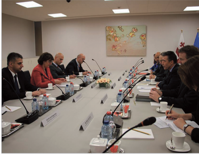
ბაზრქაძეა მე-2 გვერდზე

რასმუსენი საქართველოს მიღწევების შესახებ ვრცლად საუბრობს.