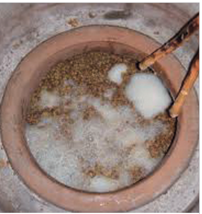
ბაზრქაძეა მე-5 გვერდზე

4 დეკემბერს, საქართველოს კულტურისა და ძეგლთა დაცვის მინისტრის გურამ ოდიშარიათა ხელმძღვანელობით საქართველოს დელეგაცია ქალაქ ბაქოში, იუნესკოს არამატერიალური კულტურული მემკვიდრეობის დაცვის მთავრობათაშორის კომიტეტის მე-8 სესიას დაესწრო.