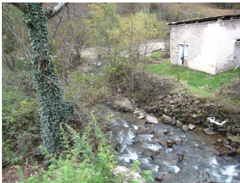
სურ.3. მდინარე დიაკონიძის შესართავი აჭარისწყალთან.