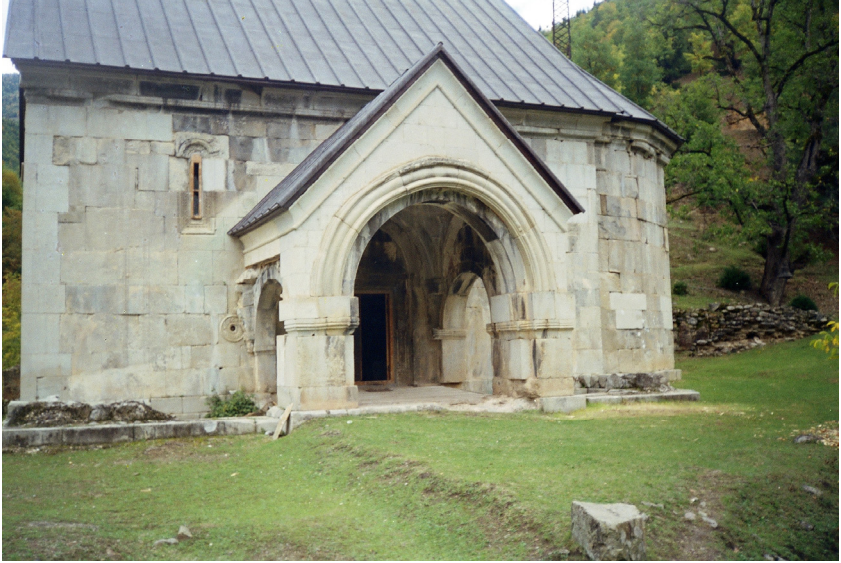
სურ. 14 სხალთის მონასტრის ხედი.

გვინდა იმედი გვქონდეს, რომ გამოჩნდება ვინმე ქველმოქმედი, რომელიც არ დაიშურებს სახსრებს | საუკუნის ქრისტიანული ტაძრის აღდგენისათვის და კვლავ წამოიმართება იქ ტაძარი. დიაკონიძეების გვარსკი ვუსურვებთ, რომ უფრო გაძლიერებულიყოს მათში უფლის სიყვარული, დიაკონიძეების გვარის უფრო მეტი წარმომადგენელი ჩამდგარიყოს უფლის სამსახურში და ღირსეულად ეზიდოთ ის ტვირთი (მოვალეობა), რომელიც დაეკისრათ მათ ახ. წ. აღ. | საუკუნიდან.