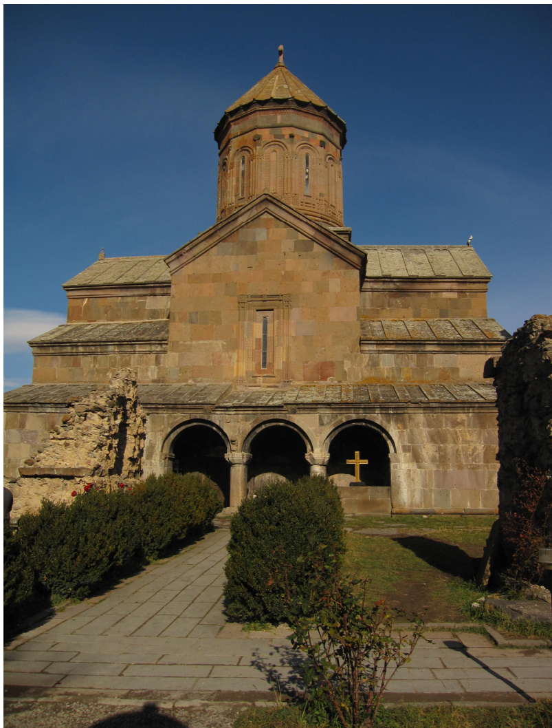
სურ.13 ზარზმის მონასტრის ხედი.