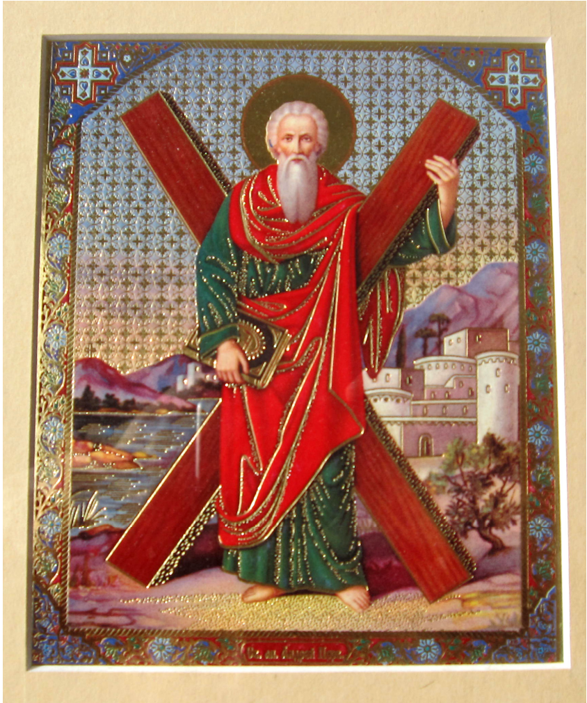
სურ. 8. წმინდა მოციქულის ანდრია პირველწოდებულის ხატის ასლი.