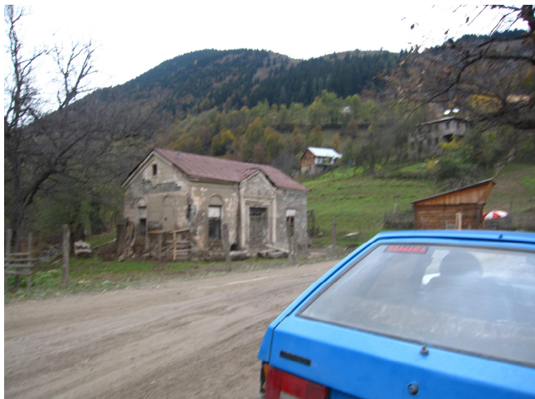
სურ.2. სოფელ დიაკონიძეების ხედი.