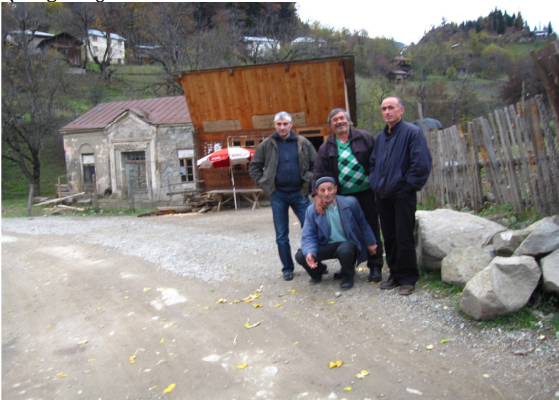
სურ.4. სოფელ დიაკონიძეების მცხოვრებლები სტუმართან ერთად.

როგორც ცნობილია, წმინდა მოციქული ანდრია პირველწოდებული საქართველოში ქრისტიანული რელიგიის საქადაგებლად პირველად აჭარის ტერიტორიაზე შემოვიდა ახალი წელთაღრიცხვის I საუკუნის 40-50-იან წლებში. მან გოდერძის უღელტეხილის გავლით იმოგზაურა კლარჯეთსა და სამცხეში, აქედან კი, ზეკარის უღელტეხილისა და იმერეთის გავლით, ქრისტიანობის ქადაგება გააგრძელა სამეგრელოში, სვანეთსა და აფხაზეთში.