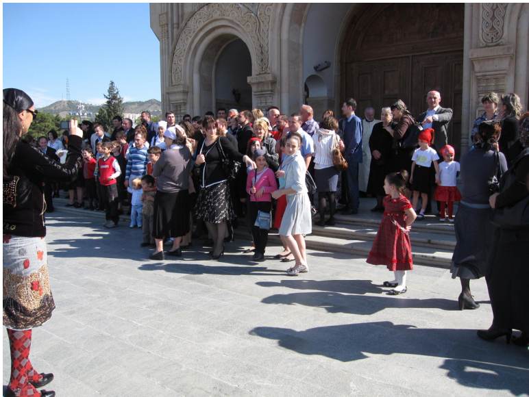
სურ. 12. საგვარეულოს კურთხევაზე მისული დიაკონიძეების გვარის წარმომადგენლები სამების საკათედრო ტაძრის შესასვლელთან.