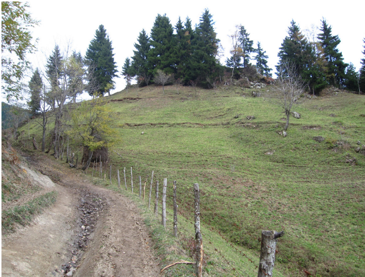
სურ. 7. პირველი ქართული ქრისტიანული ტაძრის ხედი სამხრეთის მხრიდან.