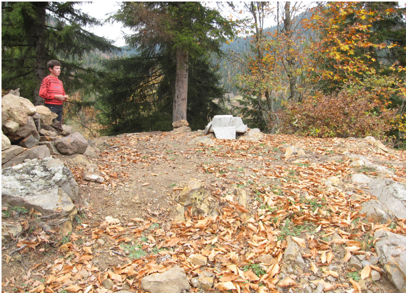
სურ.5. პირველი ქართული ქრისტიანული ტაძრის ნანგრევები საკანაფოს გორაზე სოფ. დიდაჭარაში.

პირველწოდებულის ქადაგებით. ეს ტერიტორია ეკუთვნის დღევანდელი ხულოს მუნიციპალიტეტის სოფელ დიდაჭარას, რომლისგანაც სულ ორი-სამი კილომეტრის დაშორებით, მთის ფერდობზე მდებარეობს სოფელი დიაკონიძეები. სურ. 5, 6, 7, 8, 9.