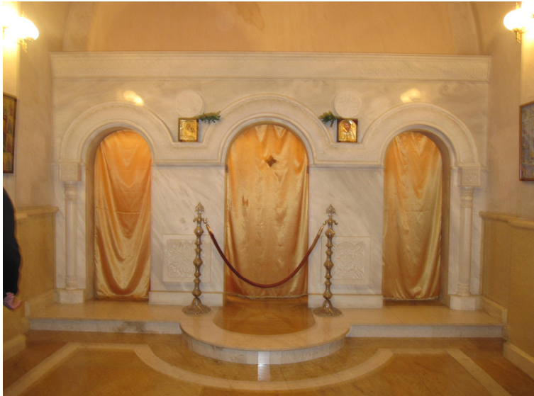
სურ. 11. წმინდა მოციქულ ანდრია პირველწოდებულის სახელობის სამლოცველო სამების საკათედრო ტაძარში.