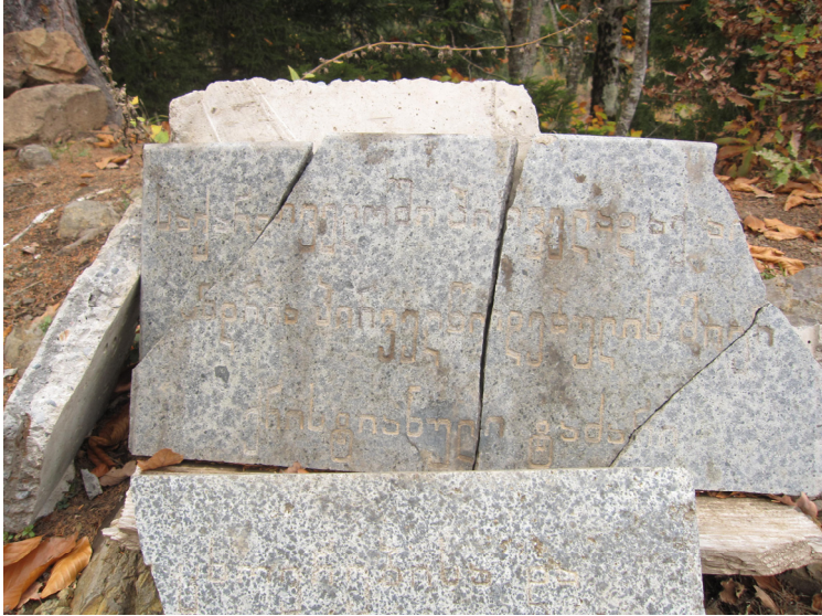
სურ.6. პირველი ქართული ქრისტიანული ტაძრის აღმნიშვნელი ნარწერა.