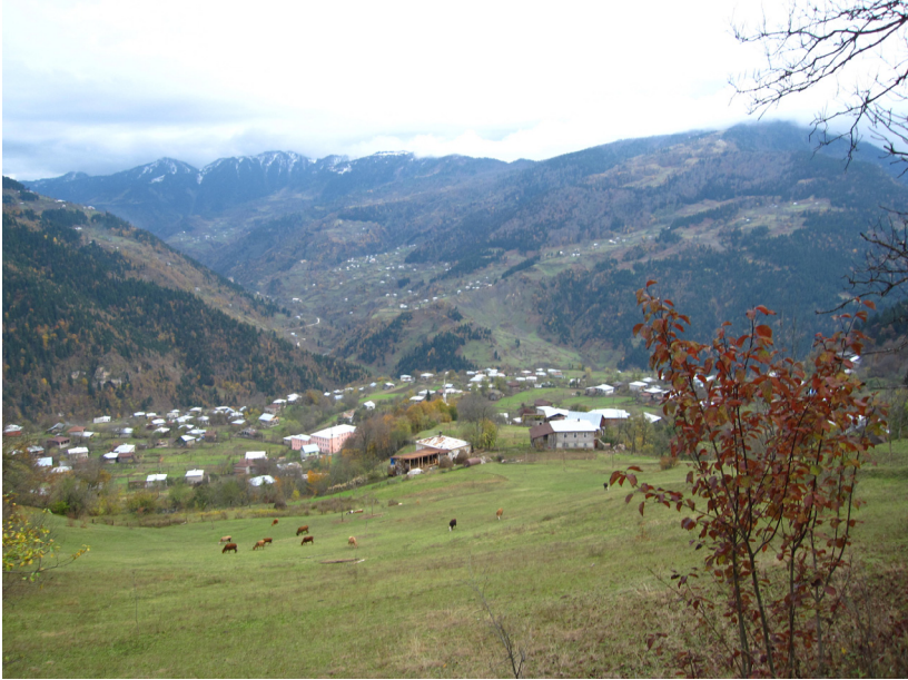
სურ.9. მდ. აჭარისწყლის ხეობისა და იქ გაშენებული სოფლების ხედი ტაძრის ნანგრევებიდან.

სოფელ დიაკონიძეების ძველი სახელწოდება, სამნუხაროდ, არ არის შემონახული. ადგილობრივ მცხოვრებთა და საეკლესიო მოღვაწეთა გადმოცემით, სოფელ დიდაჭარაში აშენებულ ქრისტიანულ ტაძარში პირველი ღვთისმსახურნი (დიაკვნები) წმინდა მოციქულ ანდრია პირველწოდებულის კურთხევით, სწორედ დღევანდელი სოფელ დიაკონიძეების მცხოვრებთაგან იყვნენ გამწესებულნი. ცხადია ეკლესიის ფუნქციონირება დიაკვნების გარეშე შეუძლებელია.