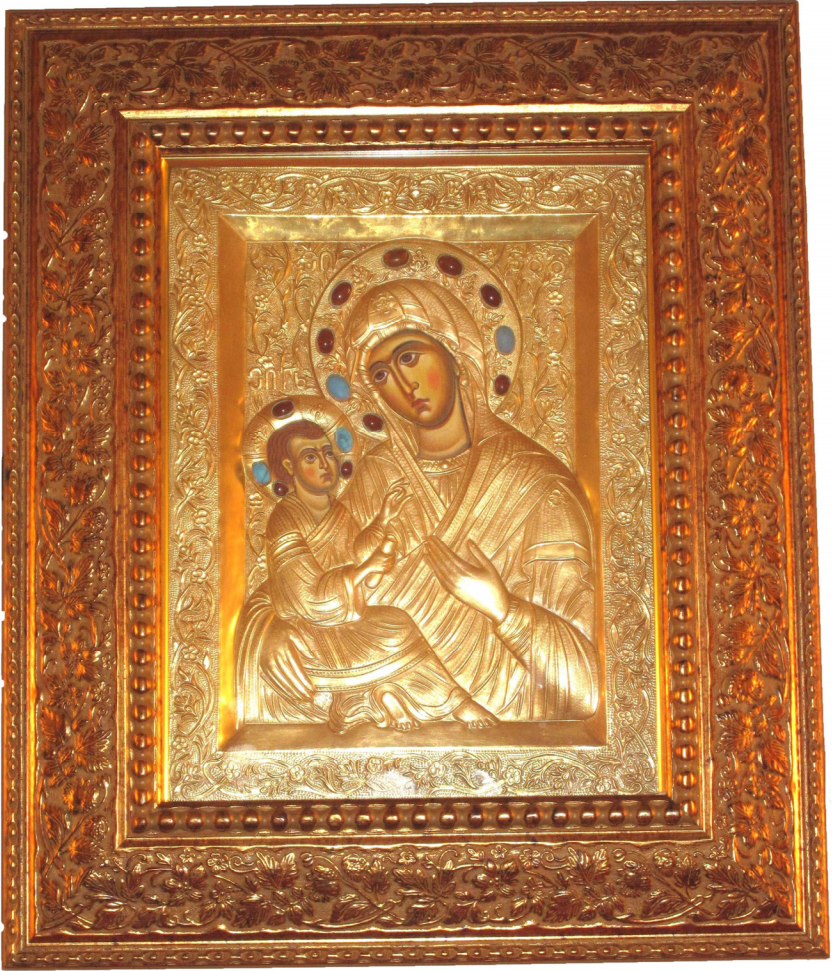
სურ. 10 სამთავისის ღვთისმშობლის დიაკონიძეების საგვარეულო ხატის ასლი.