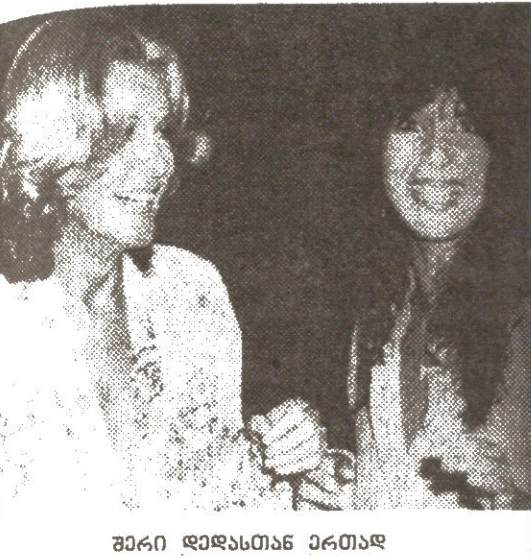
შვილი დედა განსაკუთრებით დაუმჯობესდა ჩეკი

მოულოდნელად შევხვდით იგი გვიამბობს შერის მიზანდასახულობის, პირველი სივრცის და ახლანდელი მუდღის — სონი ბონოს, შერის პირველი ოსკარის შესახებ. გლორიას ძალიან უყვარს თავის ქალიშვილებს საუბარი.