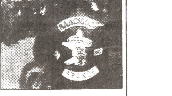
პოლიციის განცხადებით, ეს იარაღი შარშან, თებერვალში, მოიპარეს შვედეთის ერთ-ერთი სამხედრო საწარმოიდან. კლუბების ქიშპობა უკვე 4 წელზე მეტია რაც გრძელდება და იგი მთელ სკანდინავიას მოედო. დაპირისპირებას ახალი ბიჭი მისცა გასულ თვეში „ბანდიზოსის“ ადგილობრივი მეთაურის მკვლელობამ. პოლიცია მიიჩნევს, რომ მათ უკან ნარკოტიკებით მოვაჭრეთა კარგად ორგანიზებული ჯგუფი დგას.

დანიის ახალი ძალით გაჩაღდა მოტოციკლეტისტთა კლუბების „ბანდიზოსისა“ და „როკოზების“ ანგელოზების ბრძოლა. ოთხშაბათს „ბანდიზოსის“ წევრებმა კოპენჰაგენთან ახლოს „ანგელოზების“ კლუბი ნაღმსატორცნებით დაცხრილეს.