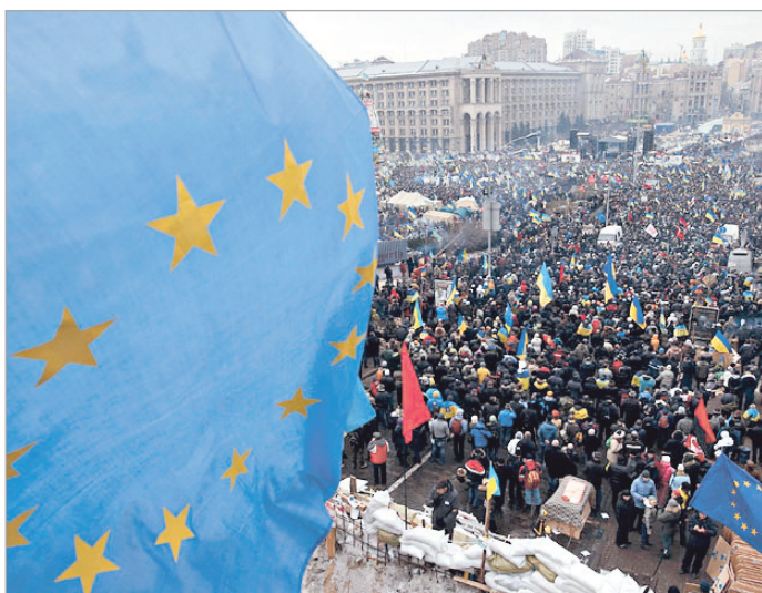
ბაზრქალაბა ბა-4 ბავარდუა

კიევში და უკრაინის სხვა ქალაქებში ევროინტეგრაციის მოთხოვნით მასობრივი გამოსვლები ისევ გრძელდება. ინციდენტები ბოლო დღეებში არ მომხდარა. ხელისუფლებამ კუნთების თამაშის პოლიტიკაზე უარი თქვა, თუმცა „ევრომიდიანთან“ ახლოს პრეზიდენტისა და მმართველი პარტიის მომხრეებმა დაიწყეს უვადო აქცია.