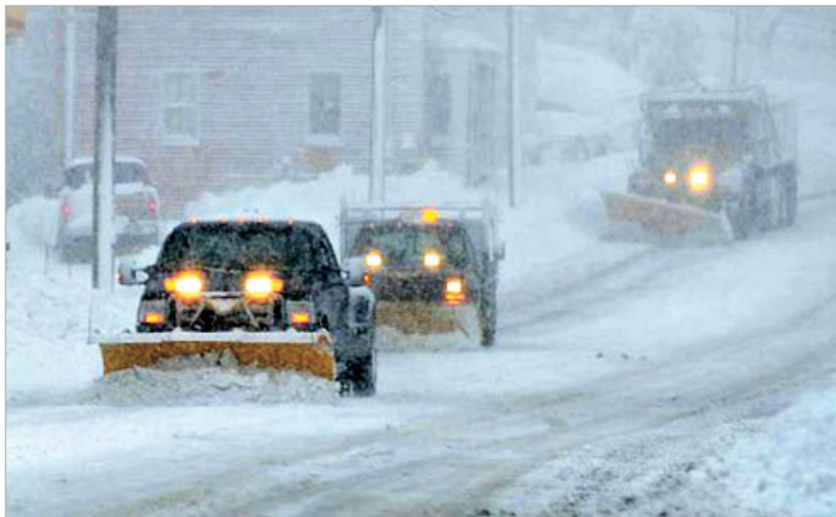
ბაზრქალაბა ბა-2 ბავარდუა

უამინდობის გამო საქართველოს გზებზე შეზღუდვები ისევ მოქმედებს. გზების დეპარტამენტის ინფორმაციით, თოვლისა და ლიპყინულის გამო მცხეთა-სტეფანწმინდა-ლარსის საავტომობილო გზის მლეთა-ლარსის მონაკვეთზე მისაბმელიანი, ნახევრადმისაბმელიანი ავტოტრანსპორტისა და 30 ადგილზე მეტი ტივადობის ავტობუსების მოძრაობა დასაშვებია მოცურების სანინააღმდეგო ჯაჭვების გამოყენებით. დანარჩენი სახის ავტოტრანსპორტის მოძრაობა მლეთა-გუდაურის(ფოსტა) და კობი-ლარსის მონაკვეთზე თავისუფალია, ხოლო გუდაური(ფოსტა)-კობის მონაკვეთზე დასაშვებია მოცურების სანინააღმდეგო ჯაჭვების გამოყენებით.