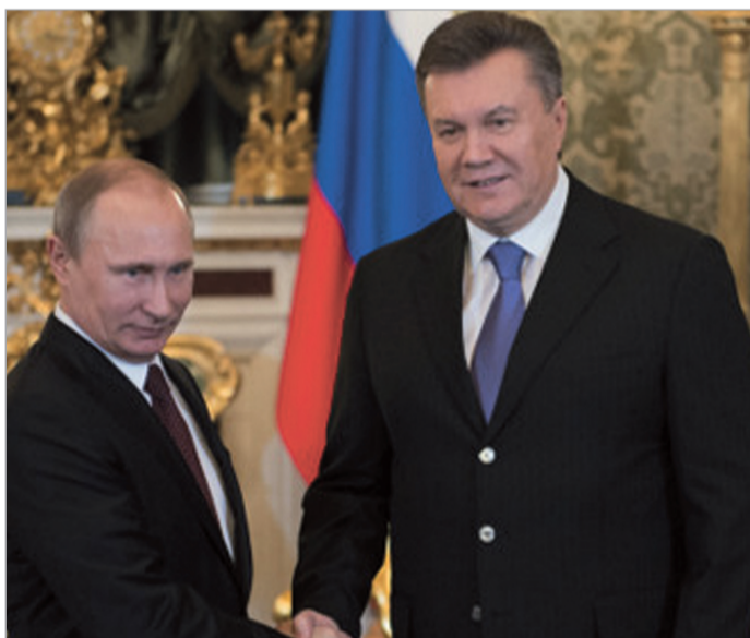
გაზრძალაბა მე-4 გვერდზე

კიევი და უკრაინის სხვა ქალაქებში ევროინტეგრაციის მოთხოვნით მასობრივი გამოსვლები ისევ გრძელდება. ინციდენტები ბოლო დღეებში არ მომხდარა. ხელისუფლებამ კუნთების თამაშის პოლიტიკაზე უარი თქვა, თუმცა „ევრომაიდანთან“ ახლოს პრეზიდენტისა და მმართველი პარტიის მომხრეებმა დაიწყეს უვადო აქცია. ორმაბათს ბრიუსელში ევროკავშირის საგარეო საქმეთა მინისტრების სხდომა ჩატარდა, რომელზეც აღმოსავლეთ პარტნიორობის პროგრამა და უკრაინის საკითხი კვლავ განიხილეს.