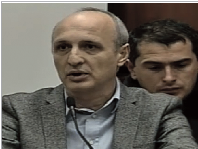
გაზრძალაბა მე-2 გვერდზე