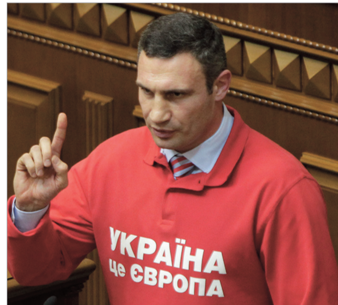
გაზრძალაბა მე-8 გვერდზე

კიევის ევრომაიდანზე მიმდინარე საპროტესტო აქციებმა ოპოზიციის ერთ-ერთი ლიდერის, კრივის მსოფლიო საბჭოს (WBC) მდიმწუნოსანი ჩემპიონის, ვიტალი კლიჩკოს შემდგომ სპორტულ კარიერაზეც იქონია გავლენა. უკრაინელმა მდიმწუნოსანმა, რომელიც რინგს მიღმა ასევე მდიმწუნოსან ლიდერად მოეწვინა უკრაინის ხელისუფლებას, სპორტული კარიერის დასრულება გადაწყვიტა.