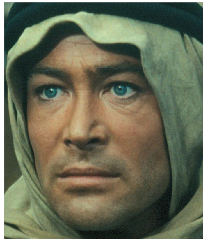
გაზრძალაბა მე-5 გვერდზე

პიტერ ო ტულის შესახებ წლების განმავლობაში უამრავი მითი დაგროვდა: რომ მისი თვალების ფერი სინამდვილეში ფერადი ლინზების დამსახურება იყო, რომ ყველა პარტნიორ მსახიობ ქალთან ჰქონდა ინტიმური კავშირი, რომ საპატიო „ოსკარის“ მიღება არ სურდა, რადგან მანამდე განცდილი შვიდგზის იმედგაცრუება კარგად ახსოვდა. სინამდვილეში კი პიტერ ო ტულის შესახებ მხოლოდ ერთი სიმართლე არსებობს - ის იყო ყველა დროის ნამდვილი ვარსკვლავი, კინოს ლეგენდა, შეუდარებელი არტისტი და ნამდვილი ჯენტლმენი.