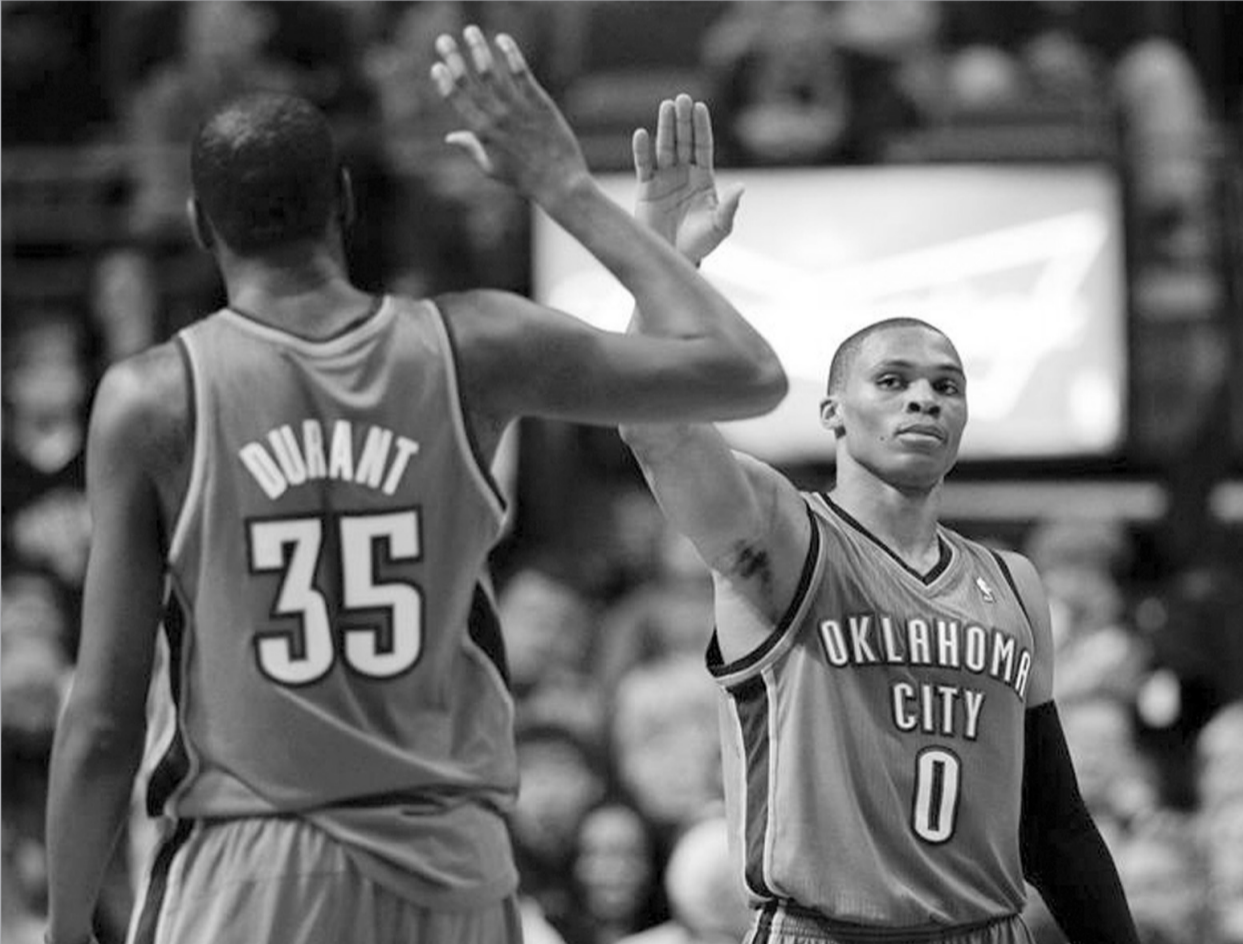
კევინ დიურანი და რასელ უესტბრუკი

ბათ ლებრონი და ინდიანა“ დაჯდება. ან. 2. ოკლაჰომა (19:4) რასელ უესტბრუკი საჭირო პერსონა და მისტერ უესტბრუკი კევინ დიურანს ხელს უშლის. მისტერ უესტბრუკმა ნაკლები სროლით და ნაკლები შეცდომით მეტი ქულის აღება ისწავლა. მისტერ უესტბრუკი ქრის ნებისმიერ დაცვას და რასი კლასია. თუ დასავლეთის კონფერენციაში ყველა ფაქტორი ჯანმრთელი იქნება, უესტბრუკი და დიურანი ოკლაჰომას“ ბოლომდე გაიყვანენ. უნდა გაიყვანონ. შარშან რასი დაიშალა და დიურანის ფანტაზია მემფისის“ სადიზმმა გადაფარა. წელს მემფისიც“ შეიცვალა. ოკლაჰომა“ ერთხელ იყო ფინალში და იქ ლებრონმა მოაგვარა პრობლემები. ოკლაჰომა“ ფინალისთვის შექმნილი ბანდაა და სერე იბაკა უმატებს. უბრალოდ, კუბს არ ჰყავს ცენტრი და იმპო-