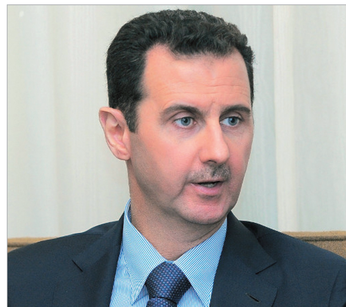
გაზრდილობა მე-4 გვერდზე

სირიის ოპოზიციის დაქსაუსულობამ და ამ ბანაკში ისლამისტების მომძლავრებამ, როგორც ჩანს, დასავლეთი დააფიქრა პრეზიდენტ ასადისა და ალავიტების დატოვებაზე სირიის ხელისუფლებაში, ყოველ შემთხვევაში, ძალიან უწყებებში. პარალელურად, თითქმის ბოლომდე ჩამოყალიბდა სირიის ქიმიური არსენალის განადგურების გეგმა, რომელიც ბევრი სახელმწიფოს კოორდინირებულ მოქმედებას მოითხოვს.