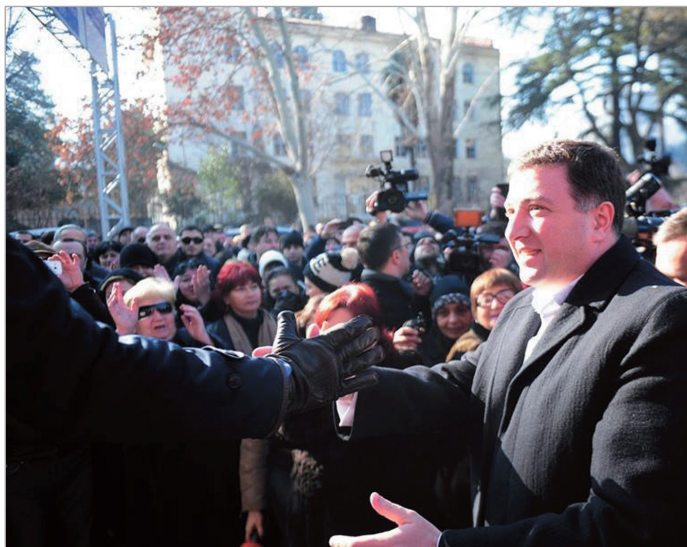
გაზრდილობა მე-2 გვერდზე

თბილისის მერს, გიგი უგულავას ბრალი წარუდგინეს. გამოძიება მას სამსახურებრივი მდგომარეობის გამოყენებით, ორგანიზებული ფონდების ფონდისთვის დედაქალაქის რეაბილიტაციის განვითარების მიზნით გამოყოფილი დიდი ოდენობით სახელმწიფო სახსრების გაფლანგვას ედავება. საერთო ჯამში, საუბარია 48 მილიონი ლარის გაფლანგვას, რომელიც არა თბილისის განვითარებას, არამედ „ნაციონალურ მოძრაობას“ მოხმარდა.