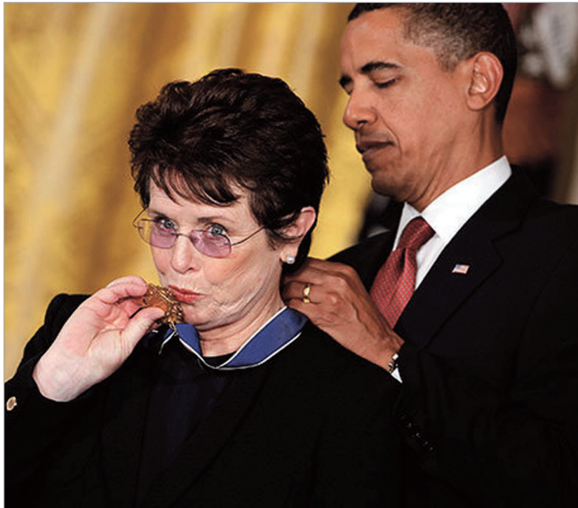
ბარაკ ობამამ ოფიციალურ დელეგაციაში ბილი ჯინ კინგი საგანგებოდ შეიყვანა

ირაკლი ლარიბაშვილის იმ განცხადებას უმალ გამოეხმაურა სპორტისა და ახალგაზრდობის საქმეთა მინისტრი ლევან ყიფიანი. მისი თქმით, საქართველოს მთავრობას მიაჩნია, რომ სოჭში სამთავრობო დელეგაციის გამგზავრება მიზანშეწონილი არ არის და რომ ოლიმპიურ თამაშებზე მხოლოდ სპორტული დელეგაცია გაემგზავრება: «ჩვენ თავიდანვე განვაცხადეთ, რომ სპორტი არ უნდა გაიგივდეს პოლიტიკასთან, ხოლო თუ ჩვენი მოწინააღმდეგე სპორტს იყენებს პოლიტიკური ინტერესებისთვის, საქართველომ იგივე ნაბიჯი არ უნდა გადადგას და სპორტსმენები უმნიშვნე-