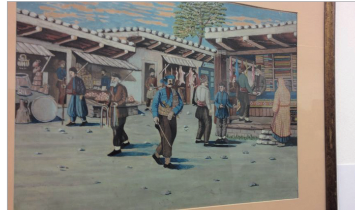
გაზრდილობა მე-5 გვერდზე

სასწაულის აღმნიშვნელი ღონისძიება. გაპროტესტებას მოჰყვა რამდენიმე მოქალაქისა და სასულიერო პირის საჯარო გამოსვლა, სადაც თავისებურ ინტერპრეტაციას ახდენდნენ ებრაელების რელიგიური დღესასწაულის დაწინაურებისა და საფრთხეების თემაზე.