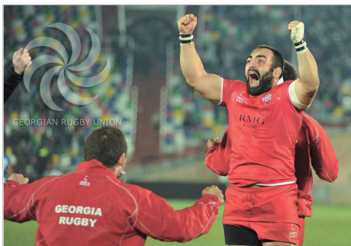
გაზრდილება მე-8 გვერდი

ლიო რეიტინგში დღეს მე-16 ადგილზეა, სამოა კი - მე-8-ზე. მეორე დონის ნაკრების მხრიდან რეიტინგის მონაწილე ათეულის გუნდის დამარცხება უკვალოდ რომ არ ჩაივლიდა, ეს ამკარა იყო.