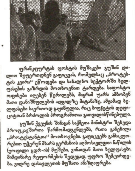
ფურცლები ფორმის მუშაკი გუნდი...