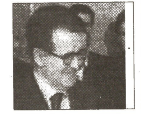
ფურცლები ფორმის მუშაკი გუნდი...