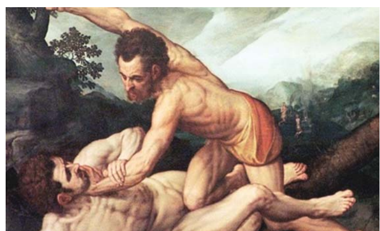
შოთა გლუარჯიკა: რუსეთ-უკრაინის ომი - აბალინსა და ქაენის ბიბლიური სიუჰეტის თანამედროვე პარიანტია