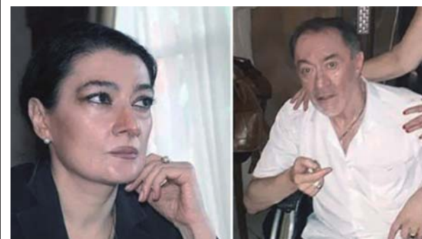
კაცო, მიქელ-გაბრიელი რომ მოგადგა ცელით და ბიძინა ივანიშვილმა უკან გაგიბრუნა, რა ნამუსით ავინებ, არ გრცხვენია?!