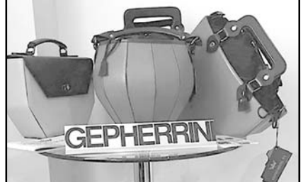
ბრენდი 2014 წელს შეიქმნა და თავიდან ქალის ხელჩანთების წარმოება დაიწყო, ახლა კი უკვე მსოფლიოს ბაზარს სხვადასხვა ქართული პროდუქციით იპყრობს.

GEPHERRINI წარმოდგენილია 11 ქვეყანაში, 44 გაყიდვის წერტილით. საექსპორტო ქვეყნებია: აშშ, ქუვეითი, ჰონგ-კონგი, სინგაპური, შვეიცარია, საფრანგეთი, შვედეთი, რუსეთი, ყაზახეთი, უკრაინა და აზერბაიჯანი.