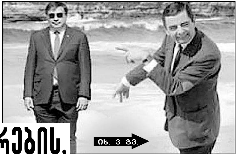
იხ. 3 გვ.

ოპოზიცია ისე გაკობრდა, ხალხი აბურად იბდებს და დასცინის, სააკაშვილი კი საცოდავ პერსონად იქცა