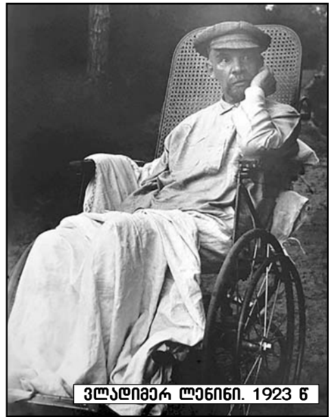
ვლადიმერ ლენინი. 1923 წ.

„სტალინი სოციალური იყო“, - განაცხადა 2017 წელს რადიო თავისუფლებისთვის მიცემულ ინტერვიუში პრინსტონის უნივერ-