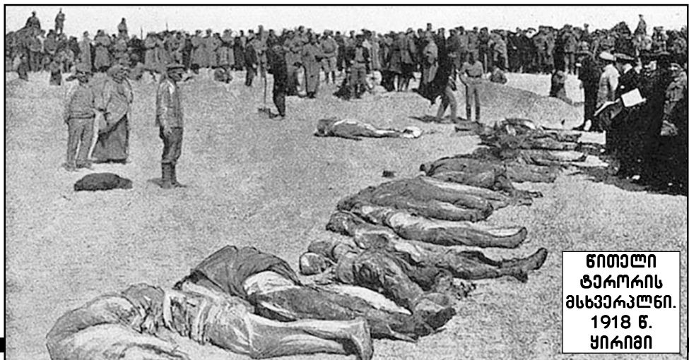
წითელი ტერორის მსხვერპლები. 1918 წ. ყირიმი

1918 წელს ლენინმა სტალინი გაგზავნა სამხრეთის ქალაქ ცარიცინში (რომელსაც მოგვიანებით სტალინგრადი ეწოდა, ახლა კი ვოლგოგრადი ჰქვია) სასაურსათო პროდუქტის რეკვიზიციისთვის ბრძანებით: „იყავი უმონყალო“.