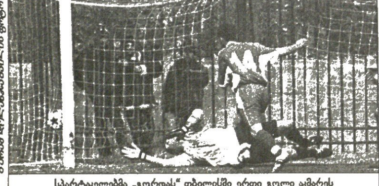
სპარტაკელებმა გორას თბილისში ერთი გოლი აგბარეს