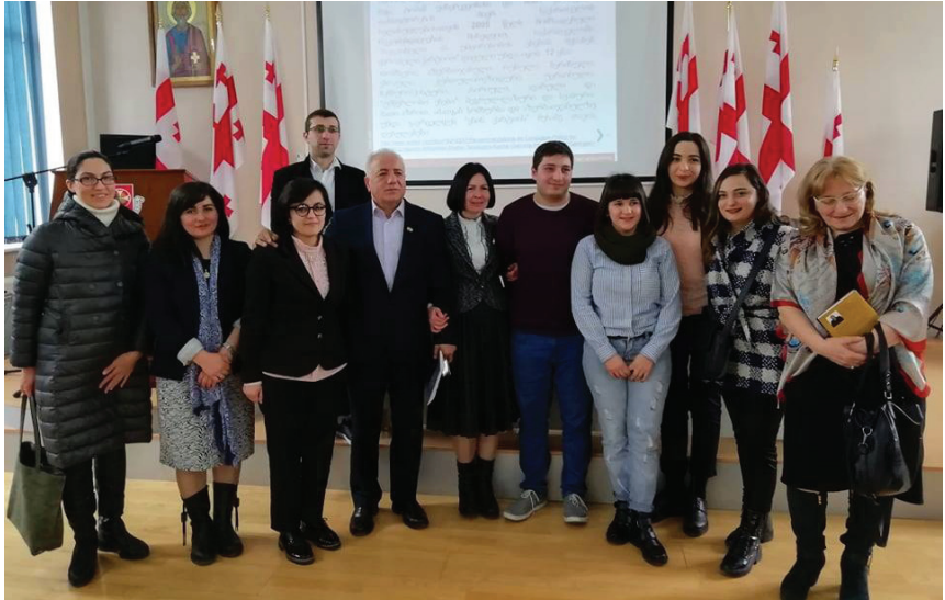
ნიგნ „ქართველოლოგიის თანამედროვე გამოწვევების“ პრეზენტაცია ქართულ უნივერსიტეტში. 2019 წელი