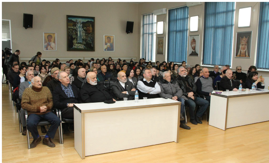
ნიგნ „ქართველოლოგიის თანამედროვე გამოწვევების“ პრეზენტაცია ქართულ უნივერსიტეტში. 2019 წელი