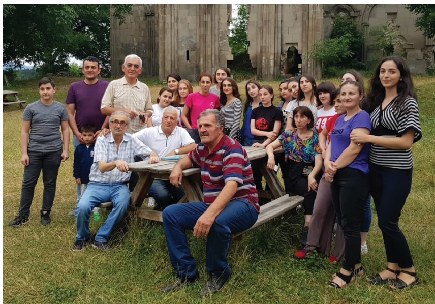
ტბეთის ტაძართან. დიალექტოლოგიური ექსპედიცია ტაო-კლარჯეთში – 2019 წელი