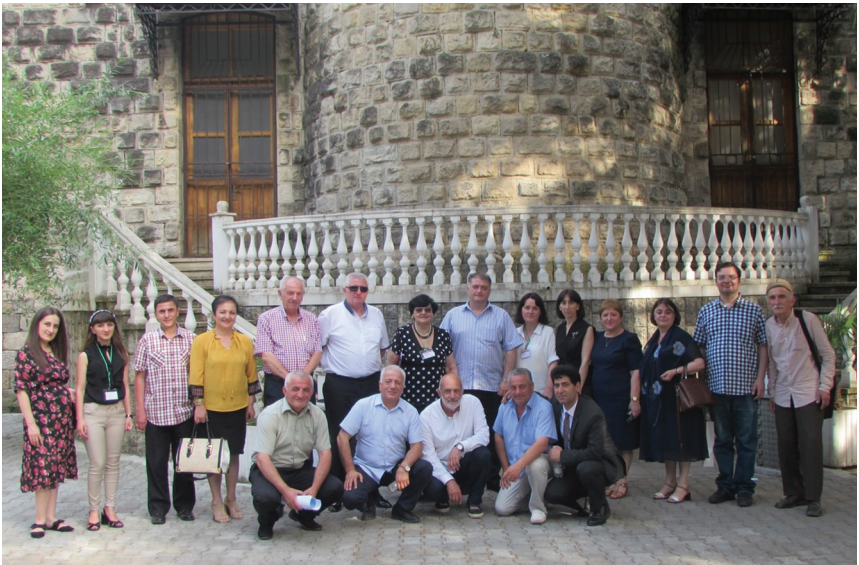
ქუთაისური საუბრები – XV. 2019 წელი