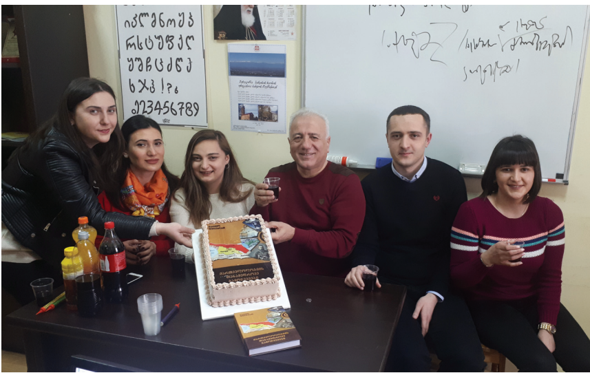
ტორტი „ქართველოლოგიის თანამედროვე გამოწვევები“. 2019 წელი