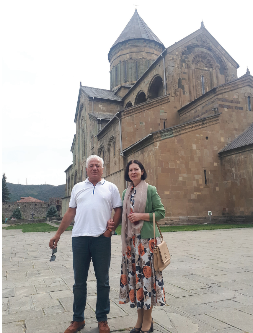
მეუღლესთან ერთად მცხეთაში. 2019 წლის 15 სექტემბერი