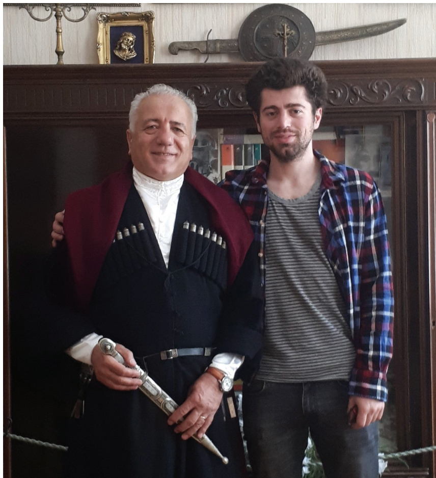
მერაბ კოსტავას სახლ-მუზეუმში