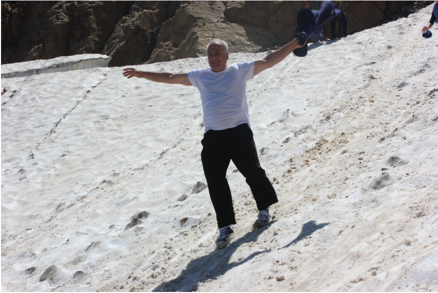
დაშვება მასისის მთიდან