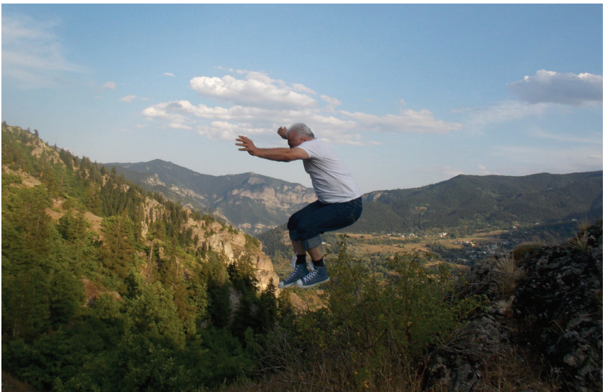
ნახტომი თამარის ციხიდან. 2018 წელი