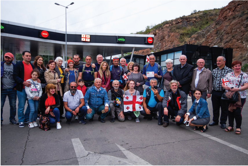
შეხვედრა 400 წლის შემდეგ სამშობლოში ფეხით დაბრუნებულ ფერეიდნელ ქართველებთან. 2019 წელი