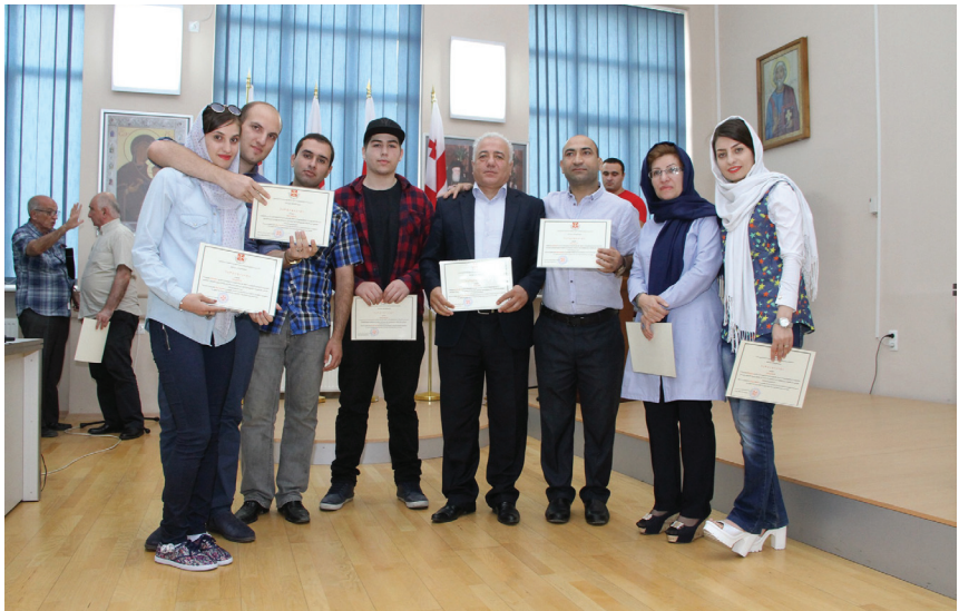
ქართული ენის პროგრამის ხელმძღვანელი და მსმენელები ქართულ უნივერსიტეტში