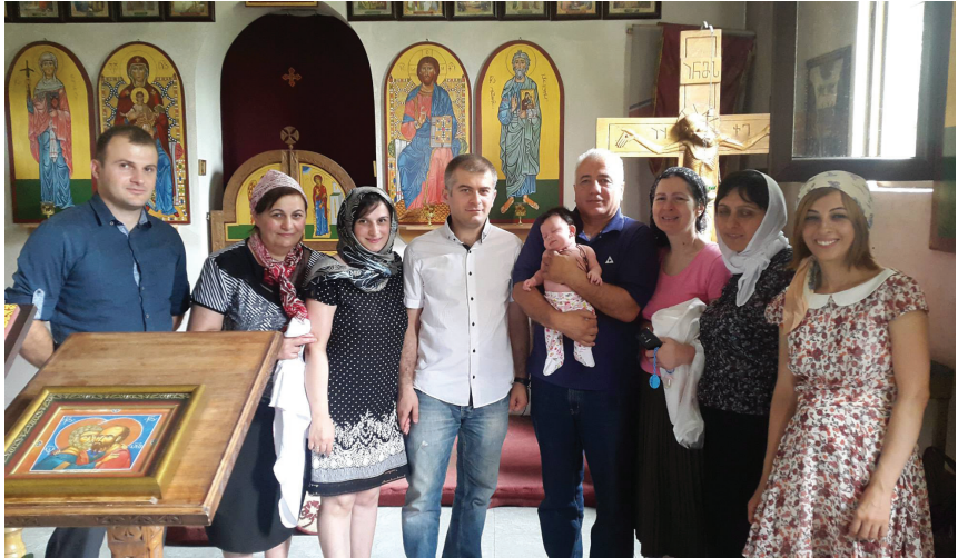
ანის ნათლობა. 2015 წელი