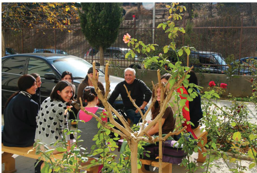
ლექცია მზის გულზე. ქართული უნივერსიტეტი