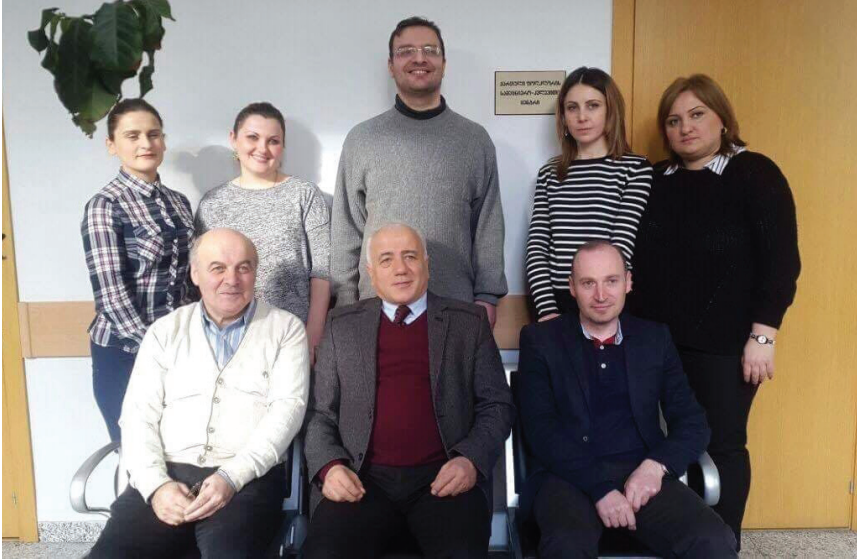
ქართველოლოგიის ცენტრის თანამშრომლები და დოქტორანტები