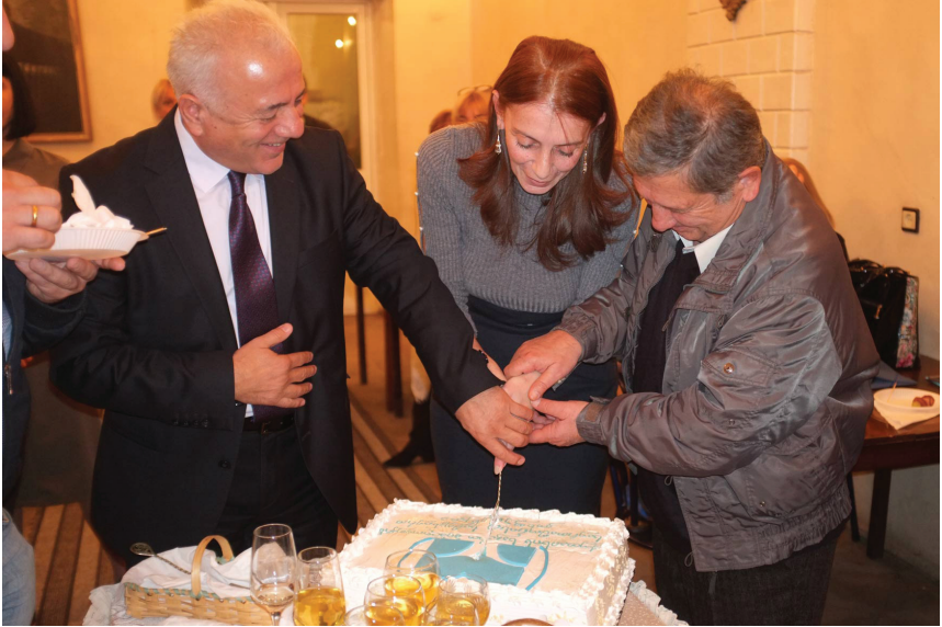
ქუთაისის ი. ჭავჭავაძის სახელობის საჯარო ბიბლიოთეკის საერთაშორისო სამეცნიერო კონფერენციის ათი წლის იუბილე. დამფუძნებლები. 2019 წელი