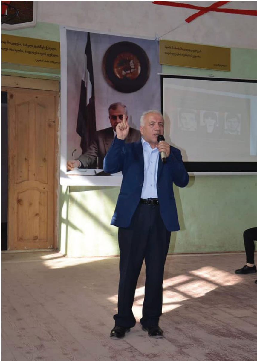
ზვიად გამსახურდიასადმი მიძღვნილი შეკრება ნიკო ნიკოლაძის სახლ-მუზეუმში. 2019 წელი