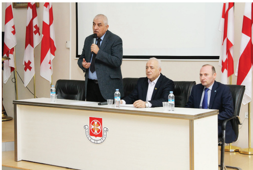
ნიგნ „ქართველოლოგიის თანამედროვე გამოწვევების“ პრეზენტაცია ქართულ უნივერსიტეტში. 2019 წელი