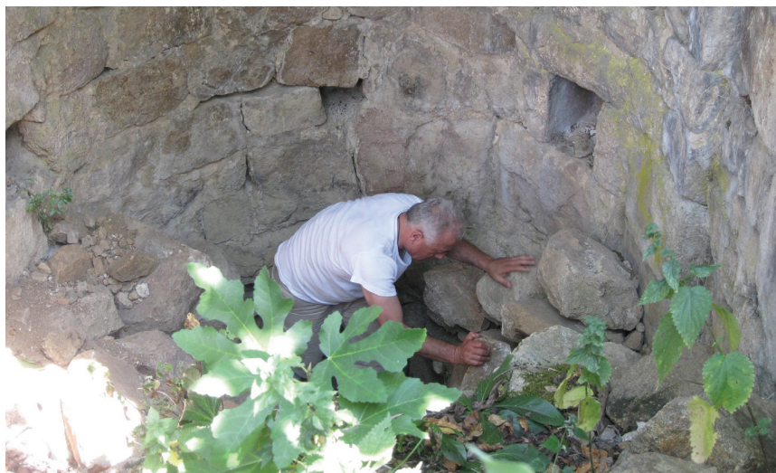
სანძთის წყაროს აღდგენა. 2019 წელი