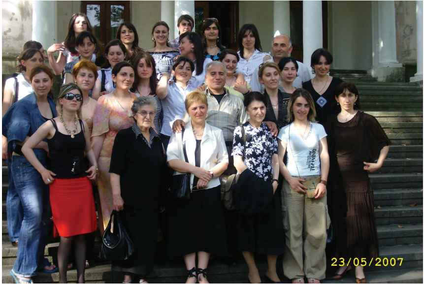
სტუდენტთა სამეცნიერო კონფერენცია – 2007. წყალტუბო