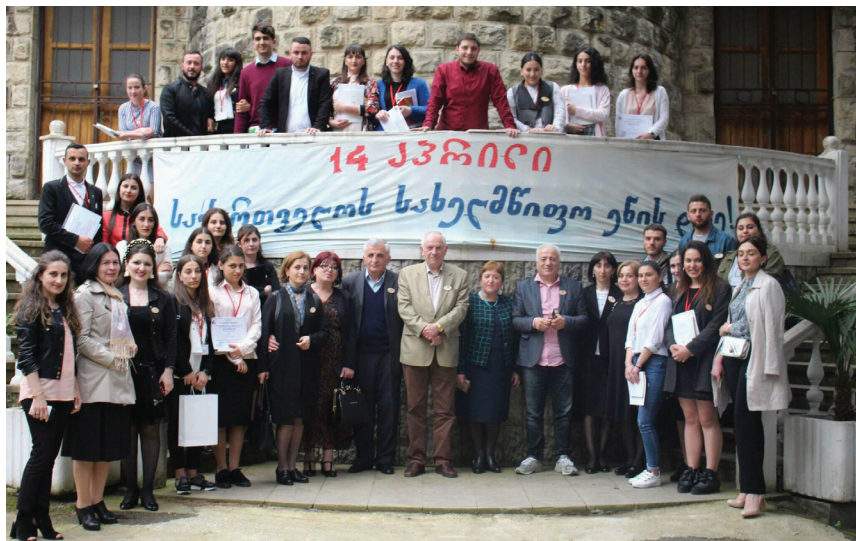
სახელმწიფო ენის დღისადმი მიძღვნილი კონფერენციის მონაწილეები. აკაკი წერეთლის სახელმწიფო უნივერსიტეტი