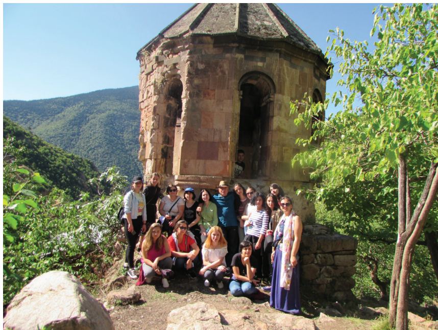
სანძთის სამრეკლოსთან. 2018 წელი