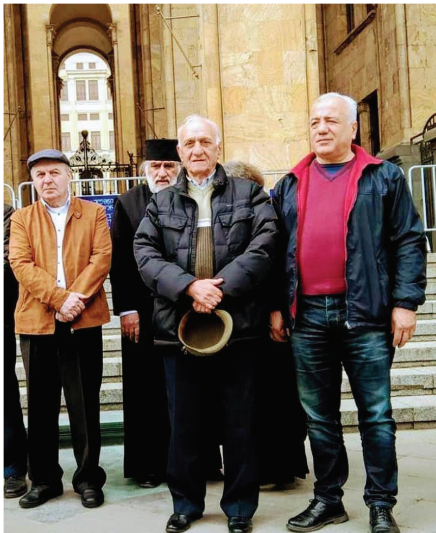
აქცია მთავრობის სახლის წინ