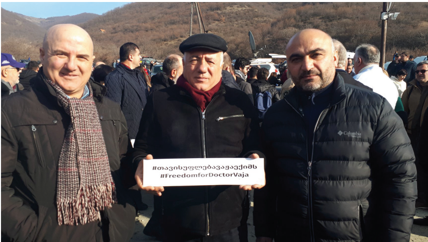
ვაჟა ექიმის მხარდამჭერთა აქცია. 2019 წელი