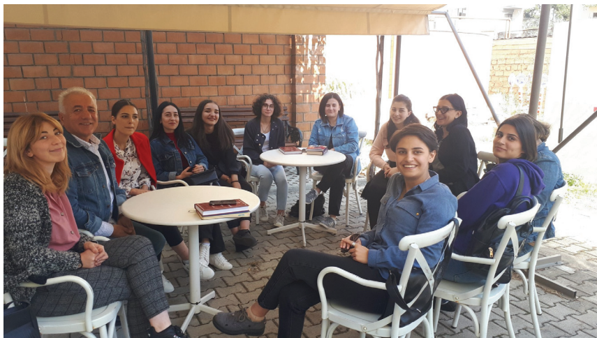
ლექცია ქართული უნივერსიტეტის ეზოში