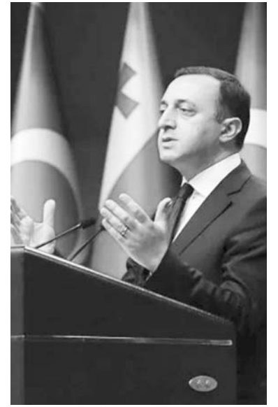
— ასეთ მკაცრ სანქციებს ვერც საფრანგეთი შეუერთდება და ვერც გერმანია. უნგრეთმა, სლოვაკეთმა და ავსტრიამ საერთოდ უარი განაცხადეს სანქციების პროცესში რაიმე სახით მონაწილეობაზე.

ბატონო ლევან, თქვენი ანალიზი ყოველთვის მიუკერძოებელია, ამიტომაც მინდა გკითხოთ, რა ხდება რეალურად რუსეთ-უკრაინის ფრონტზე?