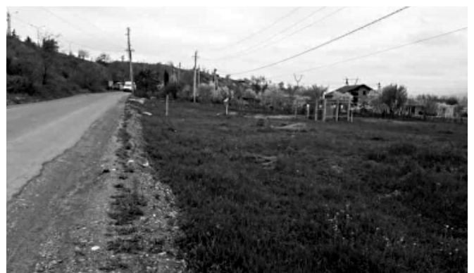
დასასრული მ-6 გვერდი

კომუნალური სერვის ცენტრის თანამშრომლებმა აღდგომის წინა დღეებში ასევე დაასუფთავეს ქანდის სასაფლაო და მისი შემოგარენი.