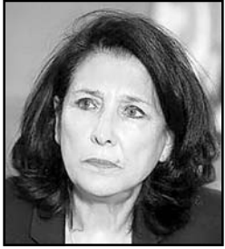
უკრაინელები ხანდახან უფრო მეტს იტხოვენ პარტნიორებისგან, არა მარტო საქართველოსგან, — განაცხადა საქართველოს პრეზიდენტმა სალომე ზურაბიშვილმა Deutsche Welle-სთან ინტერვიუში.

უკრაინელები ზოგჯერ უფრო მეტს იტხოვენ პარტნიორებისგან, არა მარტო საქართველოსგან. უხეში სიტყვები გამოიყენებს სხვადასხვა პარტნიორის მიმართ, მათ შორის ბლინკენის მიმართ, როდესაც ის კვიცში ჩადიდდა, უთხრეს: „ნუ წამოიღებთ