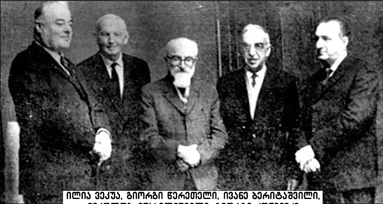
ილია ვეკუა, გიორგი წერეთელი, ივანე ბარიტაშვილი, ნიკოლოზ მუსხელიშვილი, გიორგი კონიძე

1958 წლიდან ილია ვეკუა აქტიურად ჩაერთო საკავშირო აკადემიის ციმბირის განყოფილებაში და ნოვოსიბირსკის უნივერსიტეტის ჩამოყალიბებაში. 1959 წელს ის დაინიშნა ახლად შექმნილი ნოვოსიბირსკის უნივერსიტეტის პირველ რექტორად. აღნიშნულ უნივერსიტეტში, რომელიც რუსეთის საუკეთესო უნივერსიტეტების ხუთეულში შედის, დღესაც დიდი მადლიერებით იხსენებენ