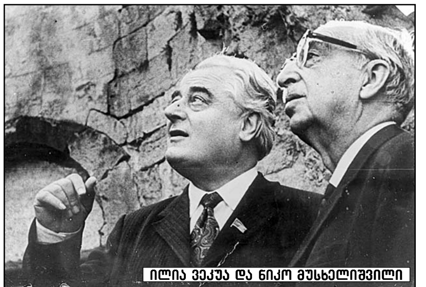
ილია ვეკუა და გიორგი შარამიძე

ილია ვეკუას მრავალმხრივმა სამეცნიერო-პედაგოგიურმა, სამეცნიერო-ორგანიზატორულმა და საზოგადოებრივმა მოღვაწეობამ მაღალი შეფასება დაიმსახურა და აღინიშნა არაერთი სახელმწიფო ჯილდოთი. იგი იყო საბჭოთა კავშირის სოციალ-