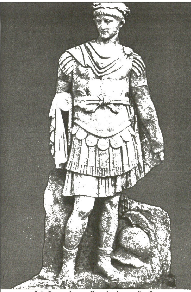
ნერონი — ცრუ ოლიმპიადის ცრუ ოლიმპიონიკი

ანტიკურ ოლიმპიურ თამაშებზე და მის მსგავს ხევა ასპარეზობებზე ძალზე მეტად დაუნდობელ სახეობად ითვლებოდა პანკრაციონი, რასაც დღეს გვაგონებს ბრძოლა წესების გარეშე, მაგრამ წინათ არანაკლებ სახიფათო სახეობა იყო ეტლებით რბოლა. ამ სახეობაში და მასთან ერთად დოღში ანტიკურ ასპარეზობებში ძალზე საინტერესო იყო გამარჯვებულის გამოვლენის საკითხი. ცხენოსანთა შეჯიბრებები მუდამ არისტოკრატიულ სახეობად ითვლებოდა, რაკილა ძვირადღირებულ ბედაურთა შენახვა და მოვლა-პატრონობა მხოლოდ მდიდართა წილზედრი იყო. მათი ბედაურები ოლიმპიაში 720 მეტრი სიგრძისა და 320 მეტრი სავანის დიდებულ იპოდრომზე ასპარეზობდნენ, მაგრამ გამარჯვებულად მხედარი და მეეტლე კი არა, ცხენების პატრონი ცხადდებოდა. ამიტომაც ხშირად ბედაურთა მფლობელები შეჯიბრებაში მონაწილეობით თავს არც იწუხებდნენ, მით უმეტეს, რომ ეს საქმე მეტად სახიფათო იყო.