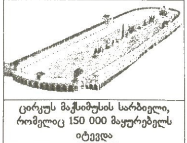
ცირკუს მაქსიმუსის სარბიელი, რომელიც 150 000 მაყურებელს იტევდა

სომხეთის მოძველი მეფე ვარაზდატის რომელიც კრეში უკვე ჩვ. წ. 369 წელს გაიმარჯვა, როცა ოლიმპიური თამაშები მწკავე დადამსვლას განიცდიდა და მისი აღსასრულიც ახლოვდებოდა. ოლიმპიურ ჩემპიონად ითვლებოდა ნერონიც, რომელიც იპოდრომზე თავისი მშვენიერი ცხენებზედებული ეტლით