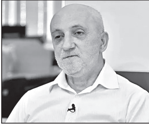
„გიორგი მარგველაშვილს თავისი პოზიციის გამო არ ვაკრიტიკებ“

– დიდი ბოდიში, მაგრამ ეს არის მხოლოდ პოლიტიკური განცხადება. საქმე ისაა, მენ თუ ამბობ, რომ შენი ტერიტორიის გავლით, რუსეთში არ მოხვდება სანქცირებული პროდუქტი, ამას სჭირდება შესაბამისი ნორმატიული აქტი.