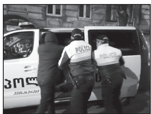
მკვლელობის ბრალდებით, 1984 წელს დაბადებული გ.დ. დააკავეს.

„შინაგან საქმეთა სამინისტროს თბილისის პოლიციის დეპარტამენტის საგამოძიებო მთავარი სამმართველოს თანამშრომლებმა, ცხელ კვალზე ჩატარებული ოპერატიულ-სამძებრო ღონისძიებების და საგამოძიებო მოქმედებების შედეგად, განზრახ მკვლელობის და ორი ან მეტი პირის მიმართ დამამძიმებელ გარემოებაში ჩადენილი განზრახ მკვლელობის